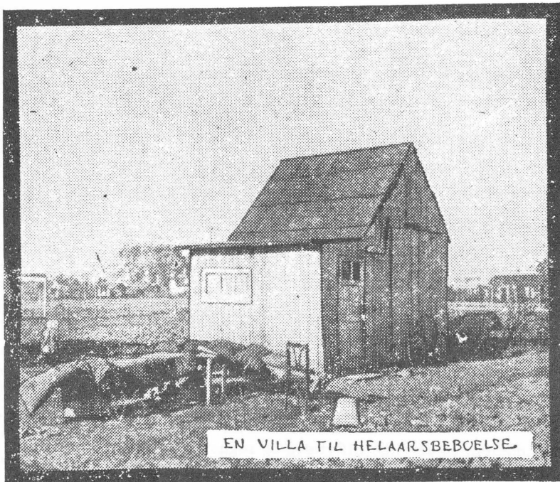
EN VILLA TIL HELAARSBEBOELSE

Foto fra BT den 17. oktober 1922. Forestiller et helårsbeboet lysthus, formentlig beliggende i Hvidovre.