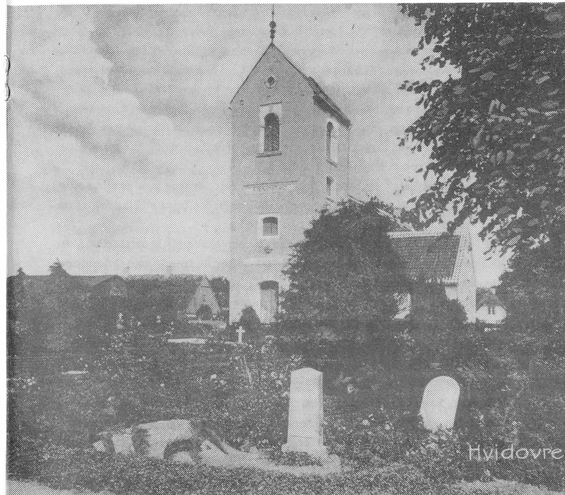
Hvidovre Kirke set fra vest. Postkort fra århundredskiftet.