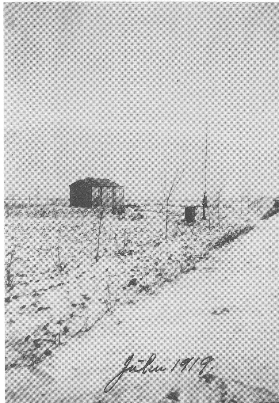
Lysthus af den mere gedigne slags på Hvidovre Mark (ved stranden).