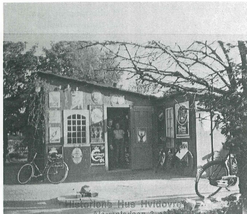
Historiens Hus Hvidovre Alarmpladsen 3 Avedørelejren 2650 Hvidovre

HVIDOVRE LOKALHISTORISKE SELSKAB RYTTERSKOLEN HVIDOVRE KIRKEPLADS 1 2650 HVIDOVRE TELEFON 36 47 34 44