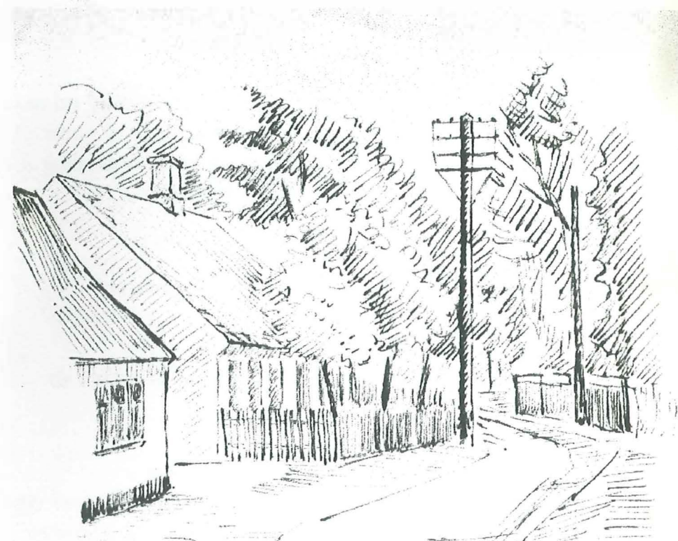
Historiens Hus Hvidovre Alarmpladsen 3 Avedørelejren 2650 Hvidovre