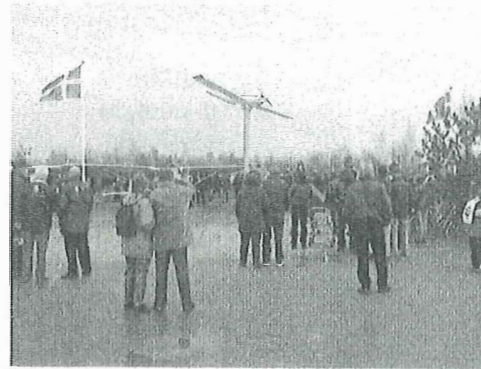
Gen-indvielsen af Avedøre Flyveplads var en succes. Mere end tusinde gæster besøgte området i løbet af dagen

Som kommunal institution kunne vi spille på nogle af de strenge, en forening har sværere ved, og pludselig var muligheden for landingsbanen til stede. Arkivet finansierede en del af jordarbejdet, og dermed kunne vi indvie vores Historien i Gaden-historie med at tage veteranfly ned på selve dagen.