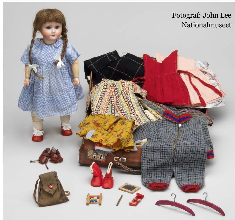
Fotograf: John Lee Nationalmuseet