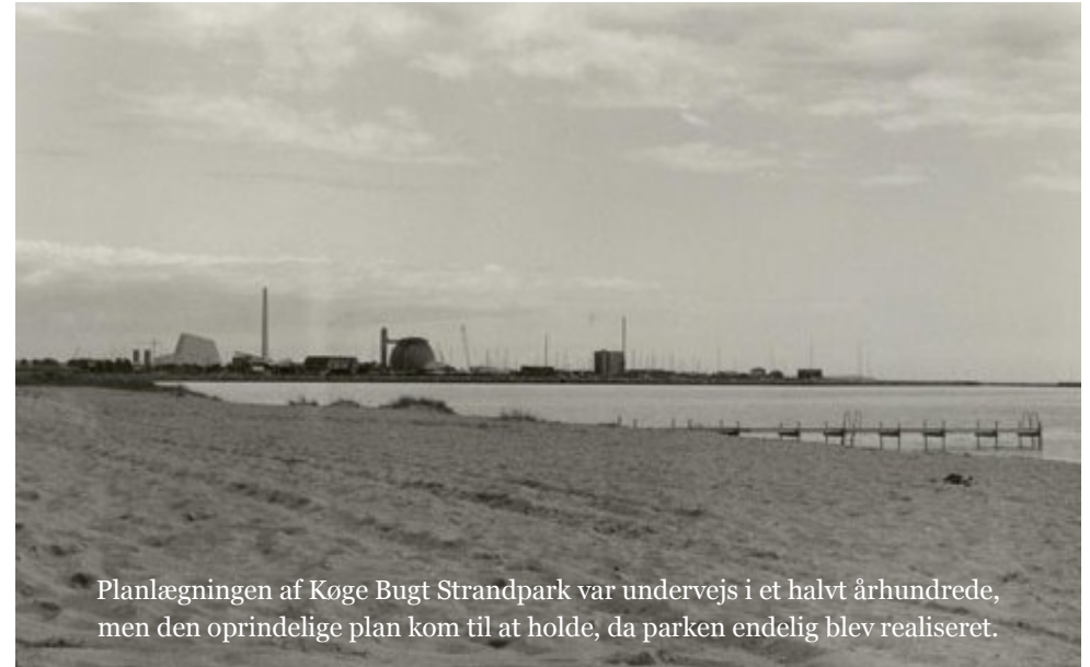
Planlægningen af Køge Bugt Strandpark var undervejs i et halvt århundrede, men den oprindelige plan kom til at holde, da parken endelig blev realiseret.

i 1936 udgav en betænkning om områder til fremtidens fritidsliv i hovedstaden. Relevant for Vestegnen var ikke mindst forslag om skovrejsning på den skovløse egn og et ønske om at få undersøgt muligheden for at lave en kunstig strand i Køge Bugt fra Avedøre Holme mod sydvest til Lille Vejleå. Begge projekter blev som bekendt realiseret senere i form af henholdsvis Vestsøen og Køge Bugt Strandpark. Det sidste projekt var ikke mindre end 45 år undervejs, før det kunne indvies i 1981, men udstrækningen af anlægget var præcis, som planlæggerne havde forestillet sig oprindeligt.