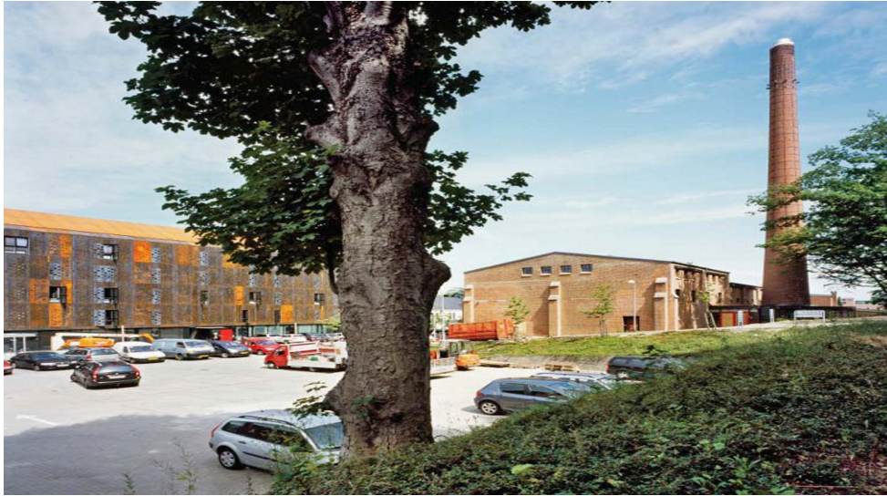
Det tidligere fabriksområde rummer i dag boliger, erhvervsvirksomheder, velfærdsservice og kulturaktiviteter, f. eks. Kulturspinderiet og Performers House, der har til huse både i nybyggeri og i de gamle fabriksbygninger. Fabrikens gamle skorsten af arkitekt Anton Rosen er blevet områdets vartegn.

målestok et enormt industriprojekt, mens den nye by voksede frem vest for åen.