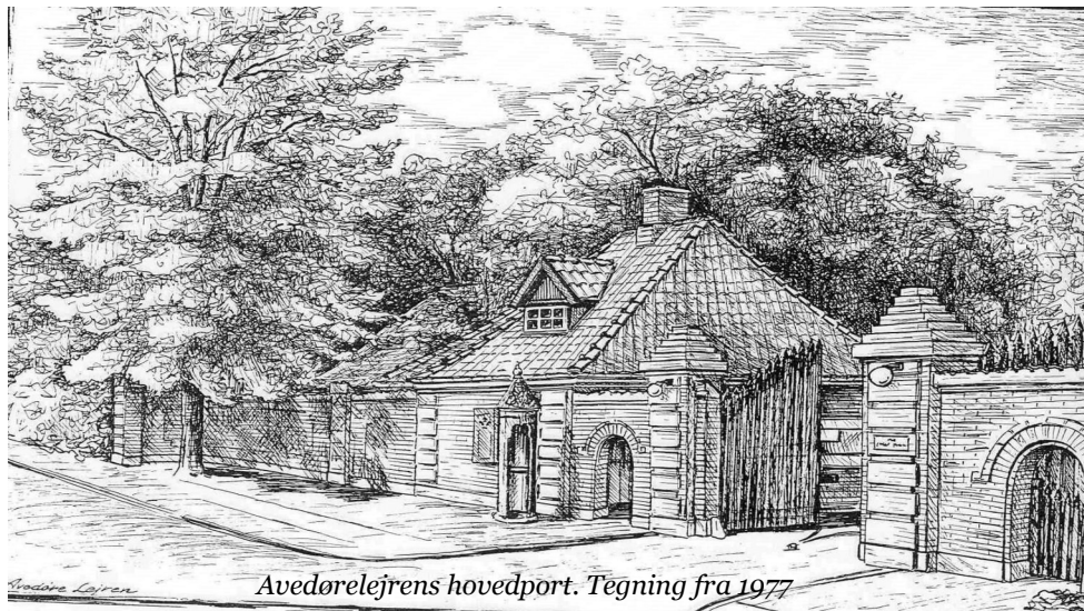
Avedørelejrens hovedport. Tegning fra 1977