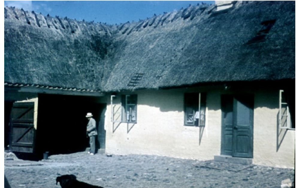
Gårdspladsen på Damgården 1944