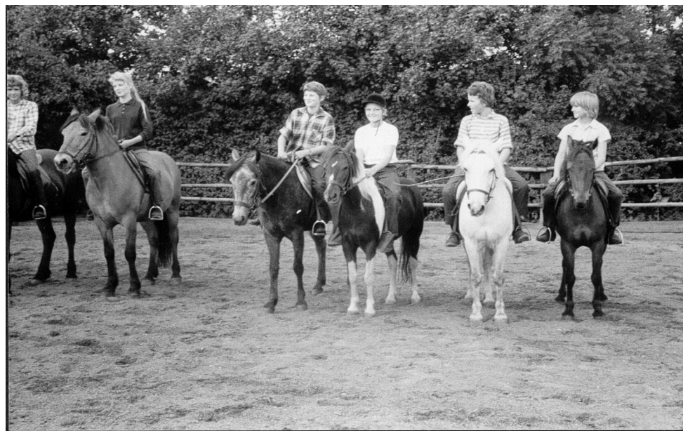
Fra Damgården i 1962. Ridepigerne poserer for fotografen