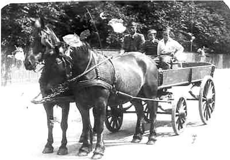
På tur med hestevognen

gift, og festen blev holdt i gårdens gildesal. De fik en lejlighed på en gammel gård i Glostrup, lige overfor Byparken. Det var et korttids lejemål, og betinget af, at man ikke skulle skaffe dem erstatningslejlighed. De kom tilbage til Avedøregårdsvej 17, den berygtede Hasselstrøm (Edderkoppen/sortbørs) havde boet der før dem, og der gik frasagn om de fester, der var holdt i dette sommerhus. Kommunen havde betinget sig, at den ulovligt opførte skorsten blev revet ned, for at forhindre dem i at blive boende om vinteren. Det gjorde de nu alligevel en enkelt vinter. Fra