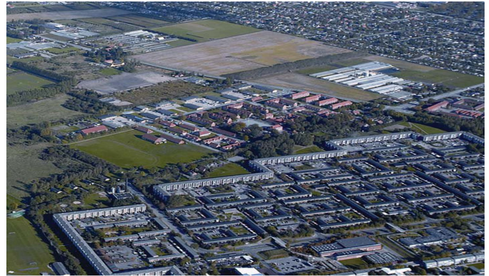
Avedørelejren havde en optimal beliggenhed for genanvendelse - tæt på stationen og med grønne områder 'i baghaven'. Bebyggelsen er markant anderledes end de tilstødende områder fra nyere tid, men der var bred forståelse for, at genanvendelsen af Avedørelejren ville give kommunen et kulturelt og socialt løft.

afløser for Paradislejren – en af de oprindelige lejre på Vestvolden, som var del af Københavns Landbefæstning, anlagt mellem 1888 og 1892. Avedørelejren blev opført mellem 1911 og 1913 efter tegninger af arkitekt Helge Bojsen-Møller (1874-1946) og udvidet i to omgange i 1933-46 og 1950-63. Bojsen-Møller havde ikke tegnet militærbyggeri før, men havde til gengæld gjort sig en del erfaring med større, offentlige anlæg som hospitaler og skoler. Til Avedøre lod han sig inspirere af ældre kasernebyggeri og havde studeret især Kastellet i København. Bojsen-Møllers oprindelige plan, inspire-