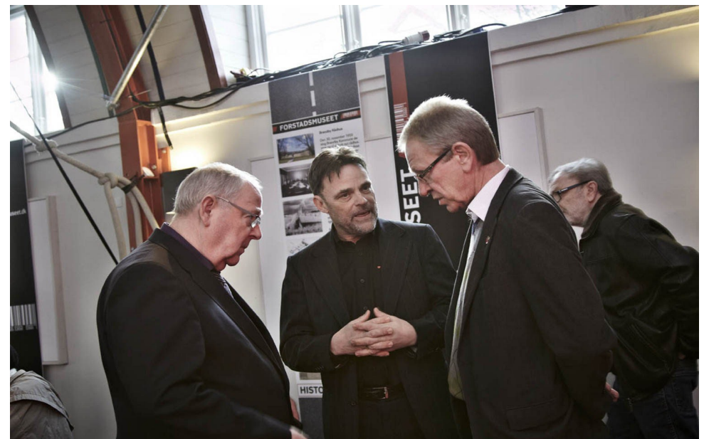
Tre vise mænd i alvorfuld dialog

Alt i alt en meget overvældende og helt fantastisk dag, hvor 200-300 mennesker var mødt op for at sige tillykke til Forstadsmuseet.