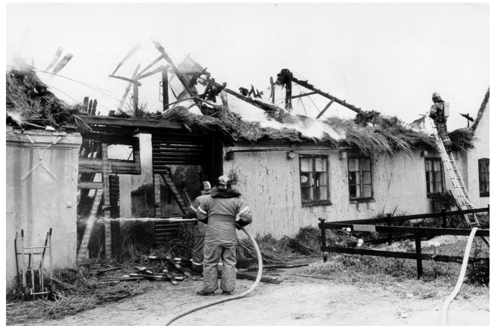
Gården med rideskole brændte i 1986

Avedøres smed var nabo til Damgården, og her blev plovjern og vognhjul repareret, og sadelmageren ordnede seletøjet. Alle bønderne i byen havde en hesteforsikring,