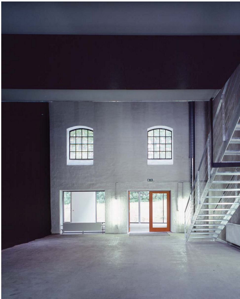
Før genanvendelsen var fabriksbygningerne generelt ikke i god stand, selvom de som udgangspunkt var solide og velbyggede, og det var ikke ligetil at finde passende funktioner til de store rum. Det lykkedes, og nu kommer områdets industrielle fortid tydeligt til udtryk i 27.000 genanvendte kvadratmeter, der danner ramme om nye aktiviteter.

ikke ligetil, men 27.000 m 2 etageareal endte med at blive genanvendt, mens en række tilbygninger og én bygning med bevaringsværdi – det gamle halvtøjshol-lænderi – blev revet ned for at skabe nye veje og pladser. Det var oprindeligt et ønske at bevare elementer, der signalerer områdets industrielle fortid såsom togskiner og kuglekogere, men det kunne kun lade sig gøre i et meget begrænset omfang. Man kan overveje, om de omkostninger, der ligger i jordoprensningen, ikke også kan omfatte en genplacering af de industrielle spor, da papirfabrikkens historie også ligger i sådanne elementer, der desuden tilføjer et område sjæl og stemning.