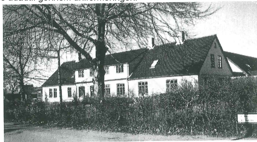
Svendbjerggård som den ser ud i dag.

Hvor meget kontakt, der ellers har været mellem Svendbjerggårds beboere og Hvidovreborgerne, er uvist. På grund af stedets karakter har Svendbjerggård antageligt fungeret som en slags selvstændig enklave med forholdsvis ringe kontakt til det omgivende samfund. Af 'forarbejder til folkeregistrets oprettelse' i Danmark, mandtals-skemaer, fremgår det, at i 1924, hvor den sociale institution havde eksisteret i syv år, havde ingen af Svendbjerggårds 12 kvindelige officerer, boet på stedet siden dets oprettelse. Hvilket skyldes, at Frelsens Hær rimelig ofte forflytter sine officerer til nye tjeneste-områder. En sådan politik har næppe fremmet de sociale relationer, men måske snarere mindsket. Selv om Svendbjerggård sikkert har fungeret nærmest som en lille selvstændig enklave, har Hvidovreborgerne naturligvis ikke kunnet undgå at lægge mærke til Frelsens Hærs tilstedeværelse, idet det religiøse tilhørsforhold bevist signale-res udadtil gennem uniformeringen.