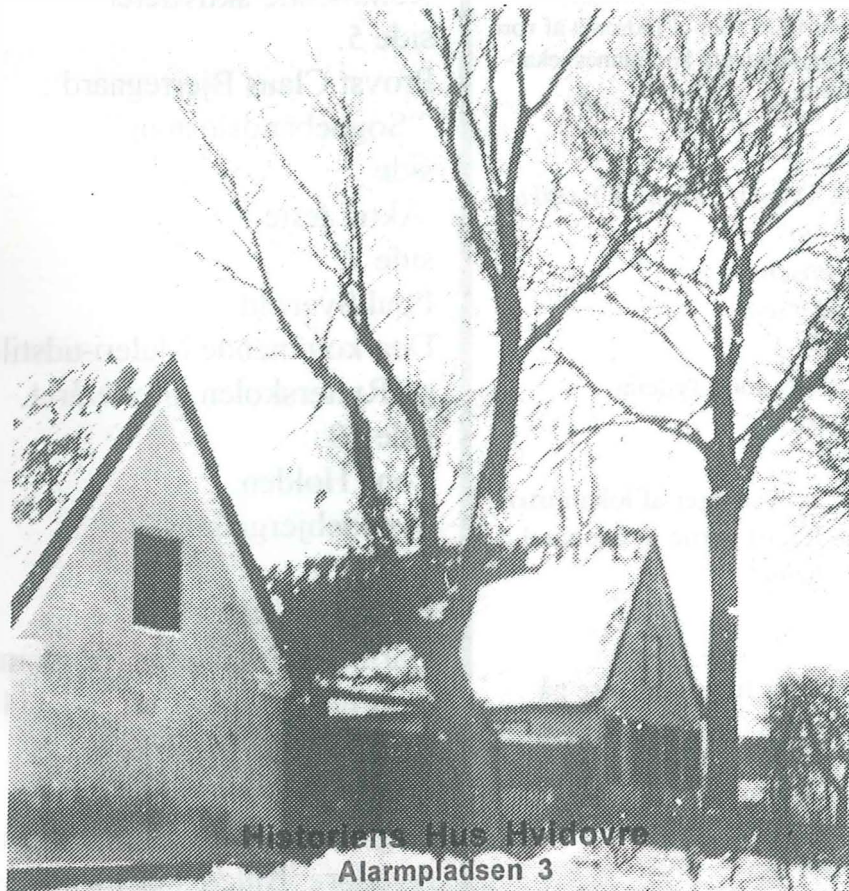
Historiens Hus Hvidovre Alarmpladsen 3 Avedørelejren 2650 Hvidovre