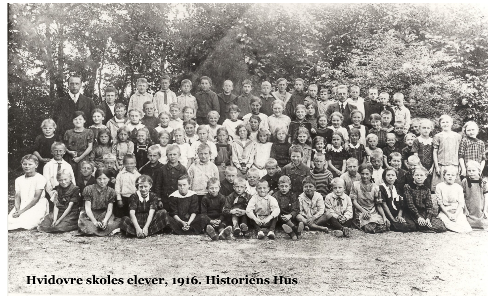
Hvidovre skoles elever, 1916.

I 1920 blev der bygget en ny skole, fordi den gamle var for lille, idet der var for mange elever. I den nye skole kom der to klasseværelser, og der blev bygget et håndarbejdslokal oppe på loftet. Der var to lærer i den nye skole. Der var ikke gymnastiksal, hverken på Rytterskolen, eller på den nye skole, så gymnastikundervisningen foregik altid udendørs.