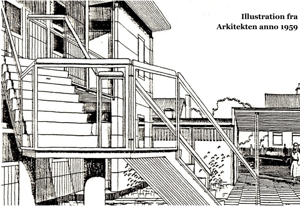
Illustration fra Arkitekten anno 1959