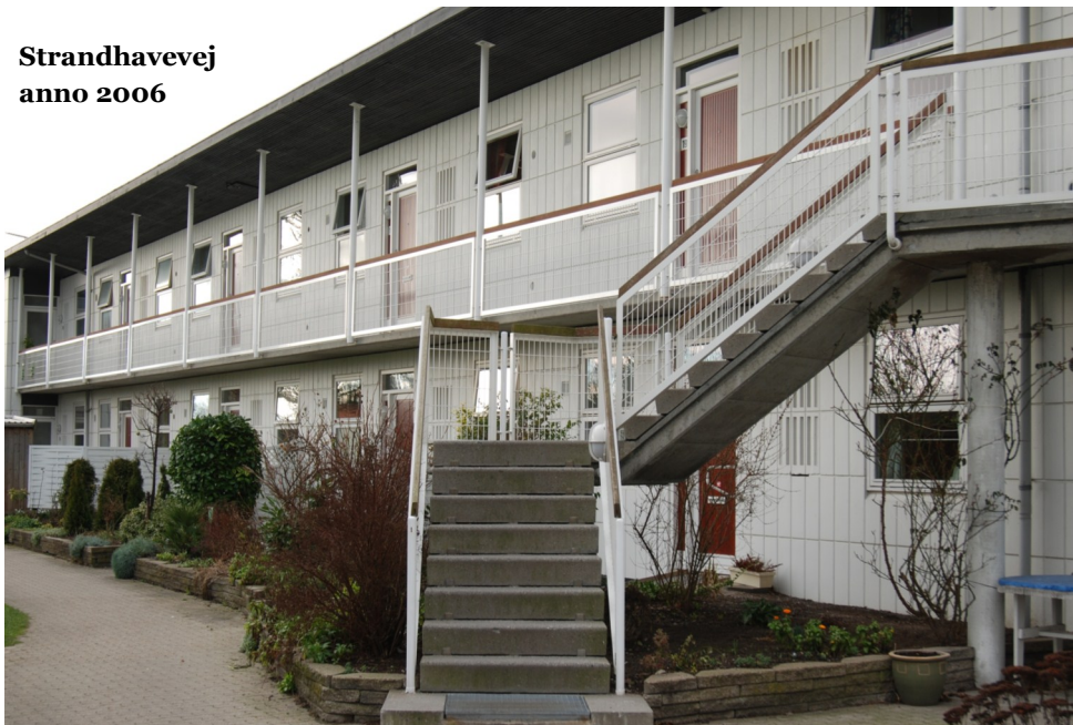
Strandhavevej anno 2006