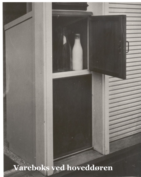
Vareboks ved hoveddøren

Vi befinder os i den almennyttige bebyggelse Strandhavevej. Et hvidt klinkerbetonbyggeri med åbne altangange og trapper i to etager.