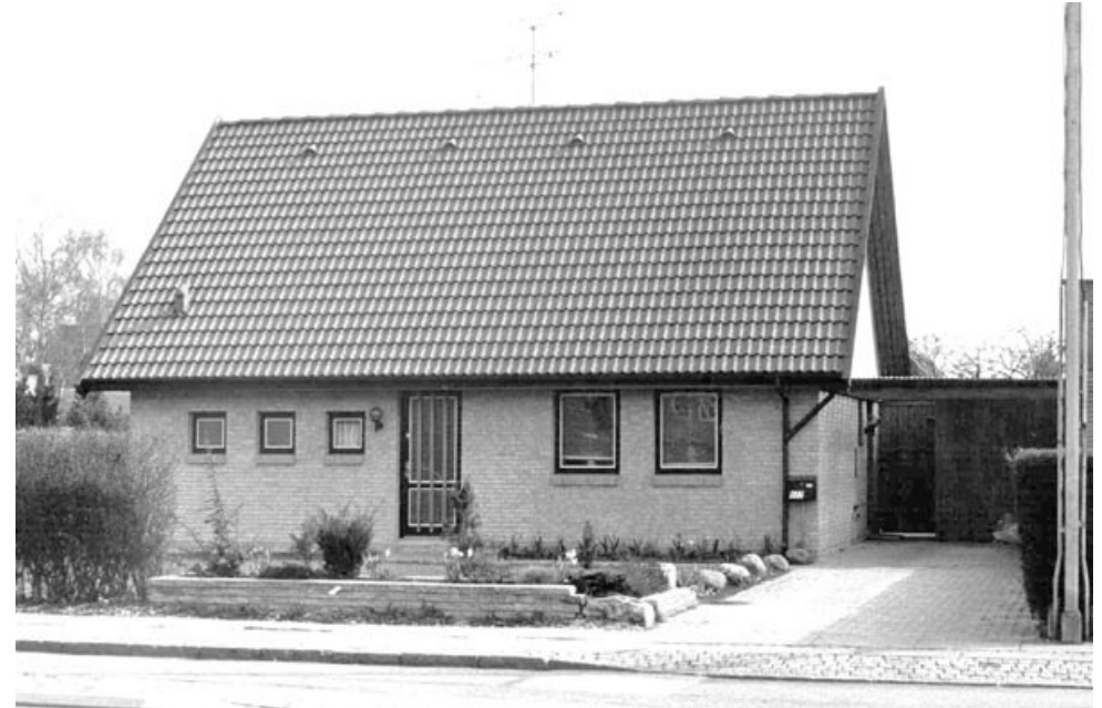
Brostykkevej 177. Der gemmer sig et Phønixhus indeni.

Efter fuldførelsen af prøvebebyggelsen, ville man til at bygge 25 yderligere huse. Disse var dog kun med 3 værelser, spisekøkken og forstue. Prisen på disse huse – stadig i bindingsværk, men med 750 kvadratmeter have – var 11000 kr. (VALBYBLADET 4/7 1924) Om der blev bygget 25 i bindingsværk, ved vi ikke umiddelbart noget om. Derimod vides det, at arkitekten