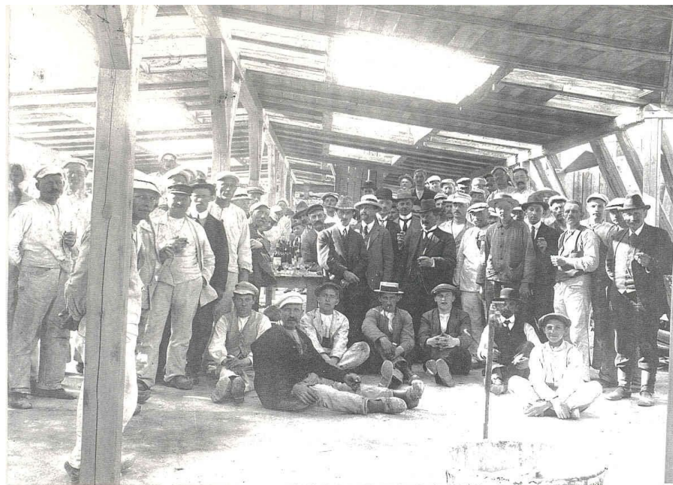
Rejsegilde på den genopbyggede fabrik 1917

Administrationsbygningen, som blev tegnet af arkitekt Carl Hansen, blev først projekteret i 1917. Den store forskel fra den tidligere kontorbygning lå i tagkonstruktionen, som var mere almindelig til forskel for mansardopbygningen.