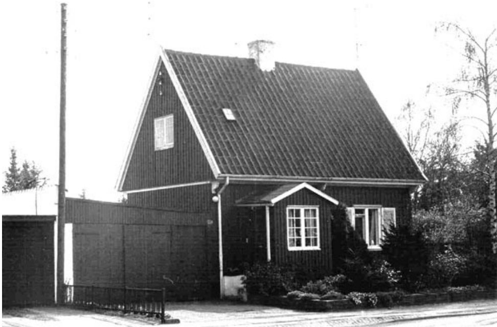
Brostykkevej 197, Phønixhus.