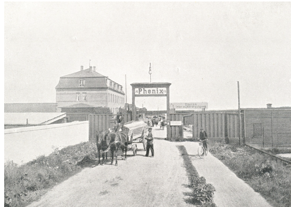
Tømmervirksomheden Phønix set fra Godthåbsvej 1910. Billedet taget på Vagtelvej