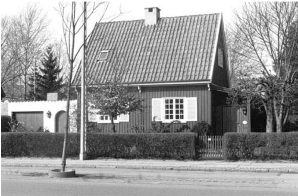
Brostykkevej 158, Phønixhus.

have gået videre, kunne man forledes til at tro, at erstatningskravet blev opfyldt.