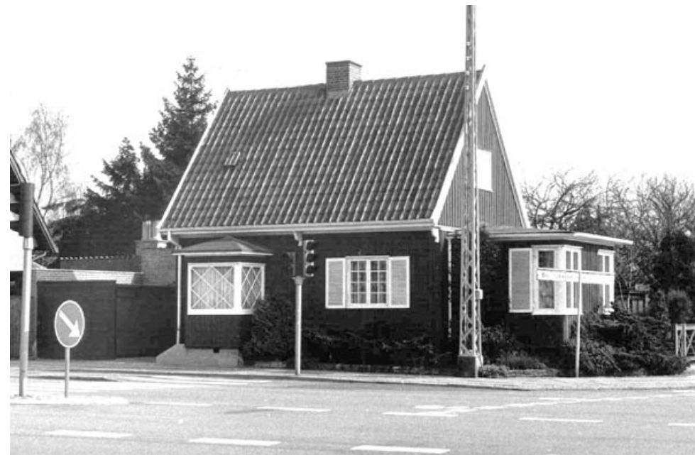
Brostykkevej 101A. Phønixhuset bærer det gamle firmas navn.