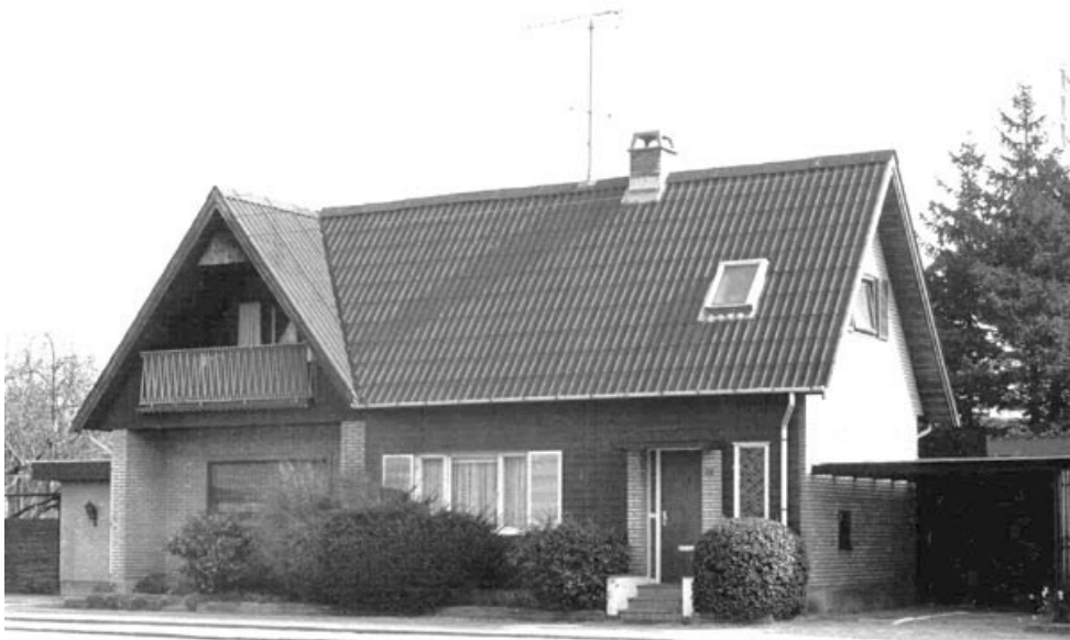
Brostykkevej 199. Der gemmer sig et Phønixhus indeni.

Der kom først et svar på tiltale en måned efter (nærmere bestemt 17/10 i VALBYBLADET). Her svarede man, at man havde taget kritikken til efterretning og højnet kvaliteten. Især flammesikkerheden og isoleringen var forbedret. Prisen på hvert hus var kun hævet med 500 kr.