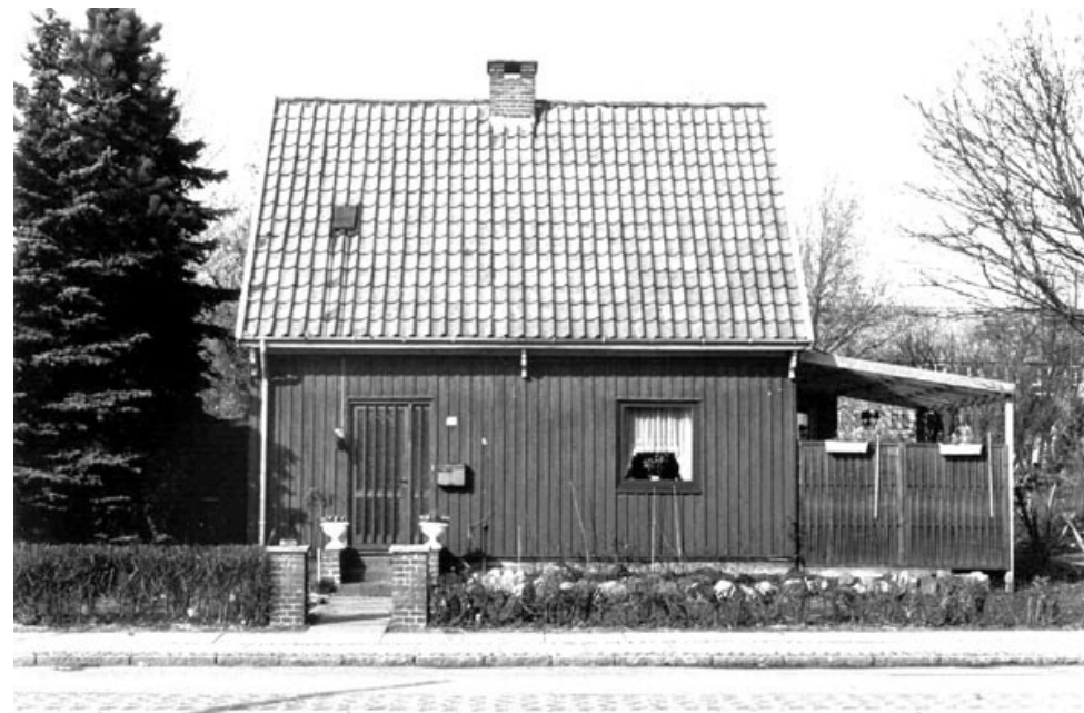
Brostykkevej 134, Phønixhus.