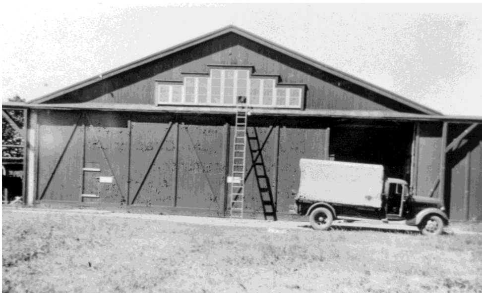
Hangar på Avedøre Flyveplads, 1940.

Det håber vi ikke vil ske igen, da det har en meget skadelig virkning