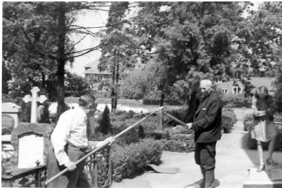
Kirkegården er normalt et fredeligt sted, men her demonstreres "Kystbevæbnings piker", fra kirkens loft. Men det er en helt anden historie.

Efter rundvisningen byder Selskabet på en kop kaffe og en snak i Rytterskolen.