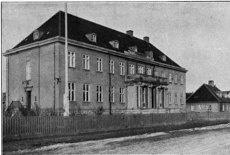
Den genopførte administrationsbygning

I 1919 beskæftigede virksomheden 6-800 mand. Ifølge "Danmarks Hovedstad København" producerede man også "de verdenskendte "Phønix" metalvarer".