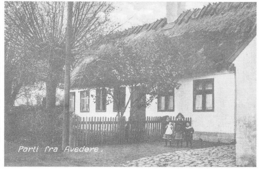
Parti fra Avedøre.