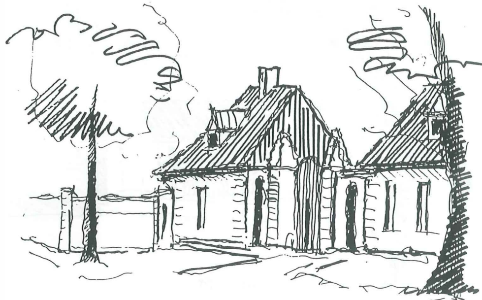
Avedøre Kaserne · 99

Men så kom krigen og efter den en eksplosiv udvikling, som har fjernet næsten ethvert spor af Hvidovre og Avedøre som ferieparadis for jævne mennesker.