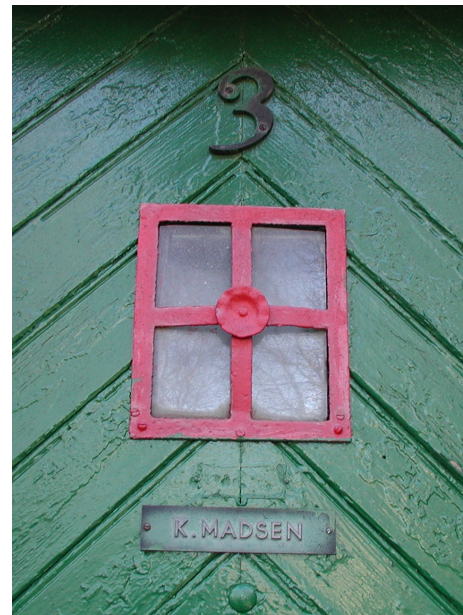
Dørens farve er skrigende grøn, og jernrammen om vinduet er dannebrogsrød, så det er en dør, som fortæller om glad sommerliv.

En anden museumsgenstand er nu ved at være færdigbehandlet, så vi kan modtage den. Det