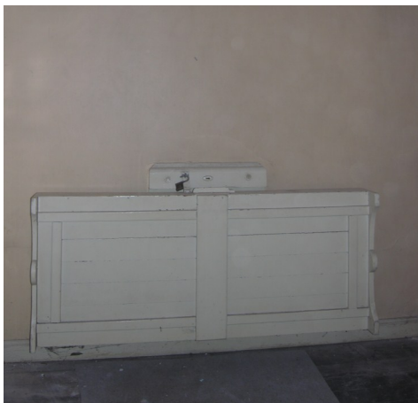
Den opklappede briks var fastgjort til væggen med en hængelås.

Inventaret omfattede en væghængt briks, som om dagen var slået op og låst fast til væggen, så arrestanten ikke kunne komme til at lægge sig på den i dagtimerne. En taburet, som var fastgjort til gulv og væg, så der ikke kunne kastes med den, og et bord, som ligeledes var naglet til gulv og væg. Til opbygelse og underholdning havde arrestanten en bibel til rådighed, og gennem det lille tilgittede vindue kunne dagslyset følges.