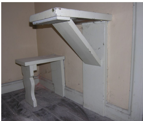
Inventaret i fængselscellerne var sparsomt men gedigent. Bord, bænk og briks.

aner man til højre under træet den mur, som omkranser den gård, fangerne fik deres gårdtur i én gang om dagen.