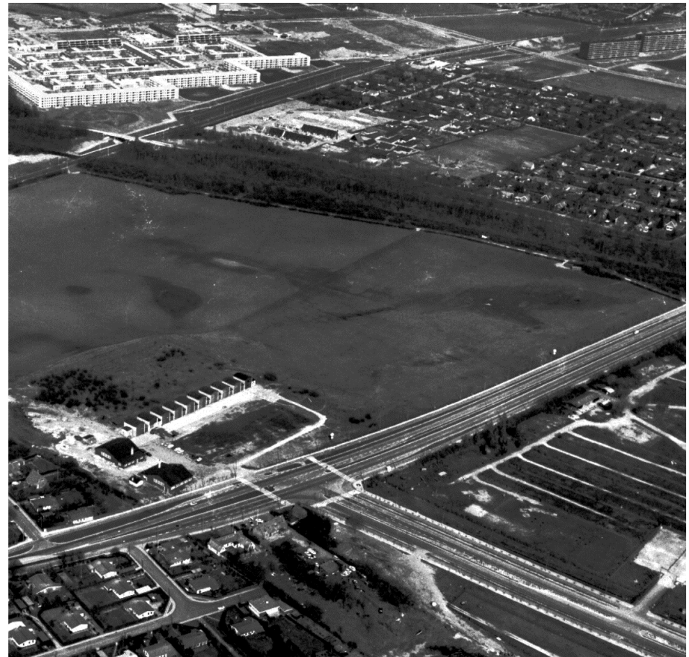
Flyvepladsens bygninger er bygningsfredet, og de åbne arealer er fredet som en del af Vestvoldsfredningen, men det samlede flyvepladsareal er ikke sikret som kulturmiljø.

afgrænsede område, der ved deres fremtræden afspejler væsentlige træk af den samfunds-