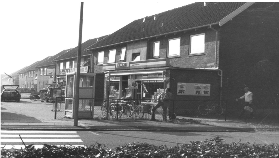
Forretningsliv i Strandbyparken