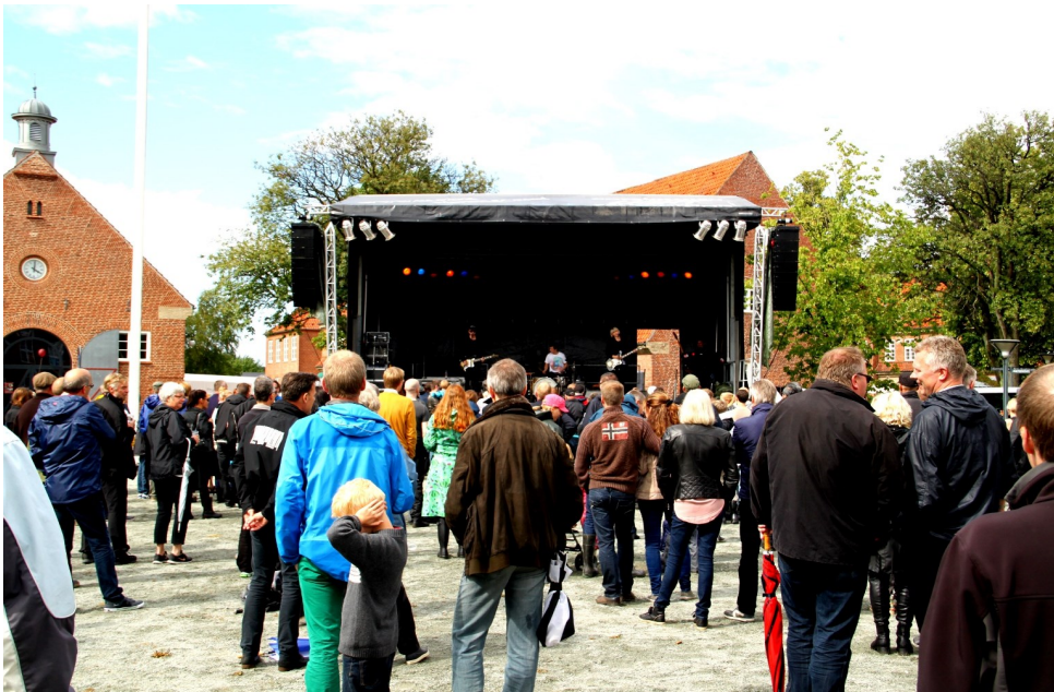
Solen kom—sammen med gruppen ”The Raveonettes”