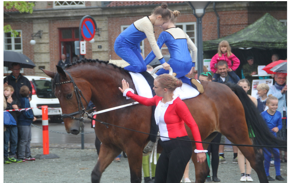
Der var stort vovemod på hesteryg