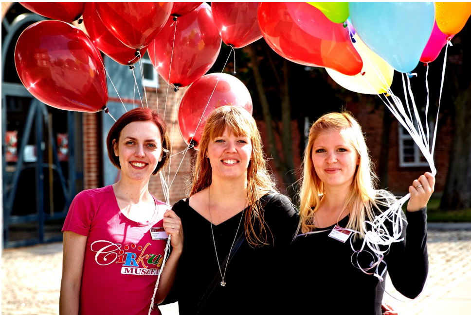
Cirkusmuseet byder velkommen til festen