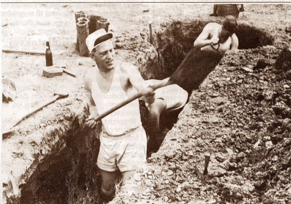
Hårdt arbejde ved håndkraft. Sådan blev HBC hallen til.