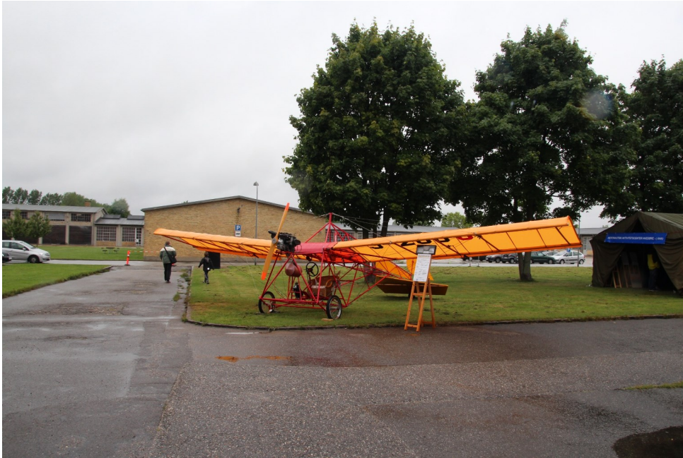
Den gode gamle Ellehammer blev også luftet