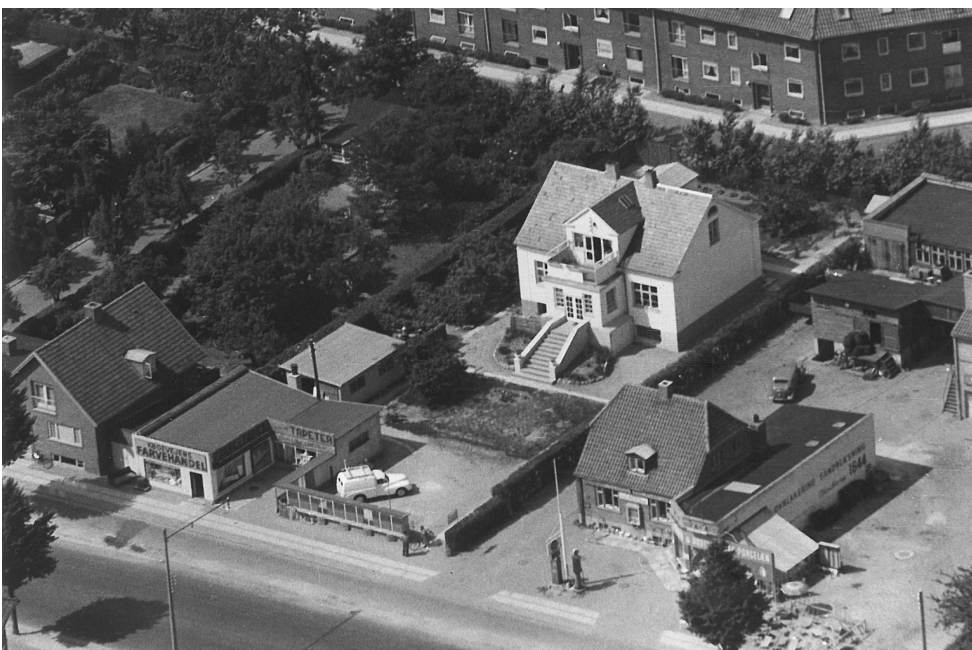
Gl. Køge Landevej 270, Køgevejens Farvehandel. Luftfoto taget ca. 1954/60

Vi serverer kaffe, te og kage dagen igennem.