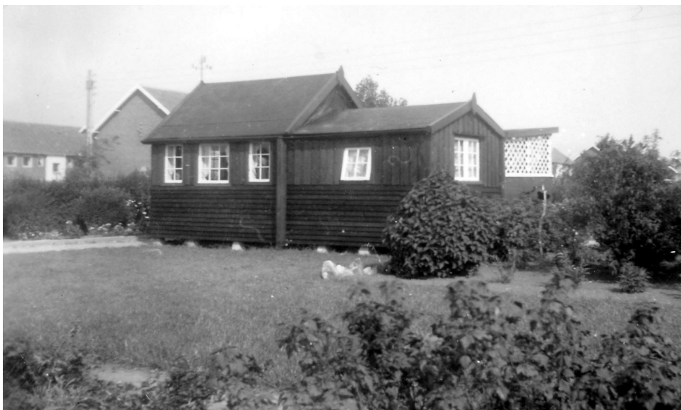
Huset på Strandløbervej 31. I baggrunden ses byggeriet i Strandbyparken

på Strandløbervej, og min mand – Mogens – og jeg tager med jævne mellemrum derud for at gense området og få frisket minderne op.