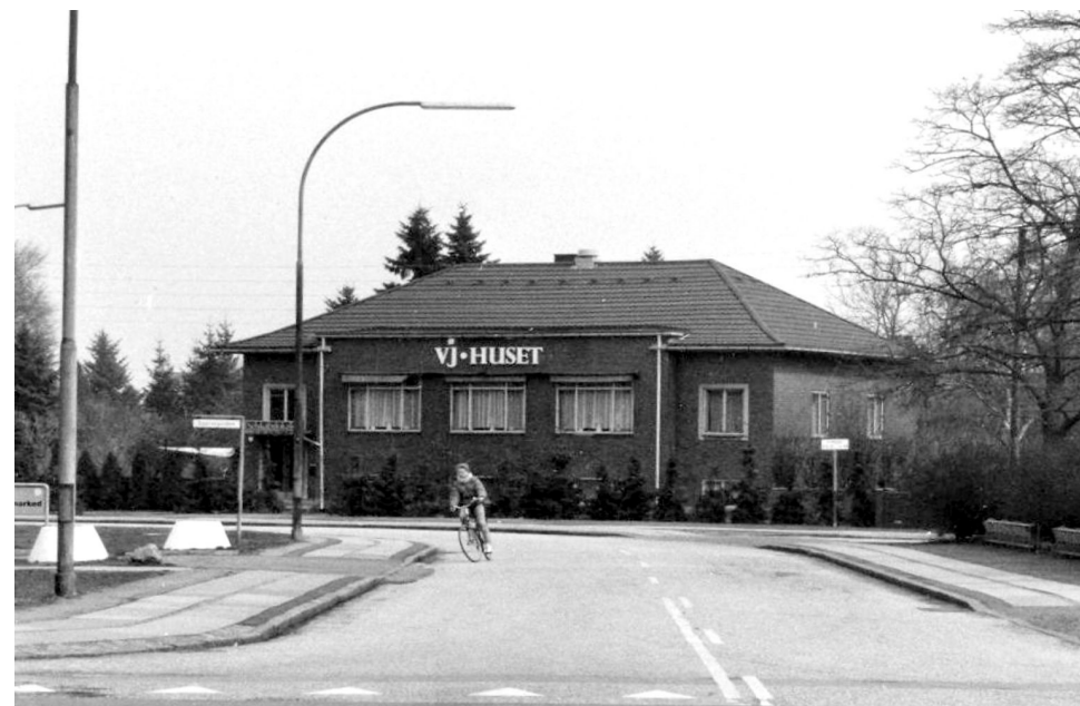
VJ-Huset i Kirkegade (tidl. Hvidovregade). Billedet er taget i april 1986.