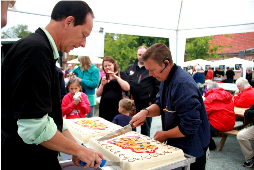
Den flotte jubilæumskage, fremstillet af Bataillon, skæres for