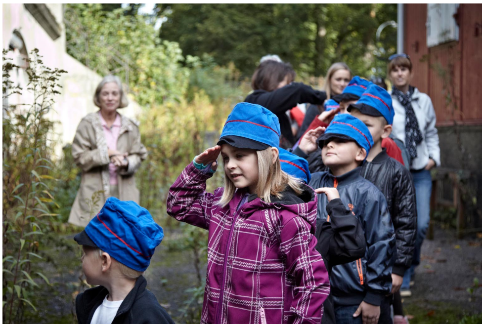
Javel, hr. sergent—ordren er forstået