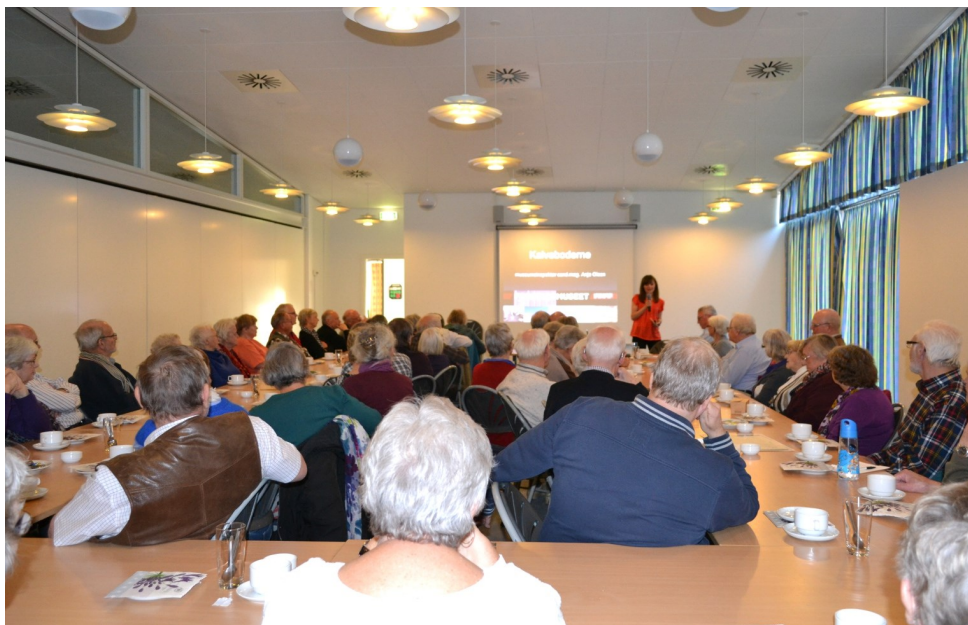
Mødet havde samlet rigtig mange tilhørere

Igen en stor tak til Bodil og Laurs for at de - med kaffe og horn - også gjorde pausen i foredraget til en værdsat periode.