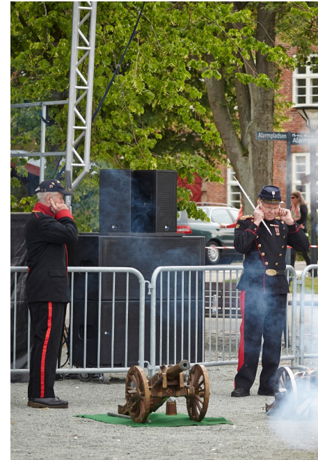
Giv agt! - der skydes