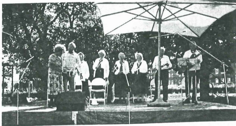
Teatergruppen REFLEXUS på scenen