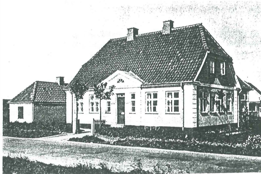
Central Hvidovre, Mellemdigsvej. Opløst 1924.

Før telefoncentralen flyttede til Mellemdigsvej lå den i et stråtækt hus i Hvidovregade.