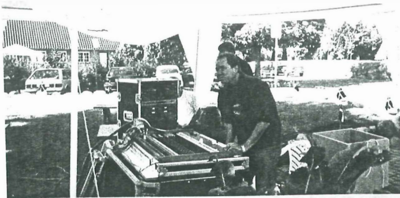
Danalund Ungdomshus stillede op med det store lydanlæg