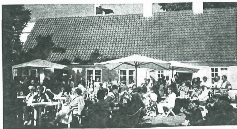
Så mange var der i Rytterskolens have. 6

Indkaldelse til: Hvidovre Lokalhistoriske Selskab's Generalforsamling Mandag d. 17. november klokken 19 30 i Bibliotekscaféen Medborgerhuset Hvidovrevej 280.