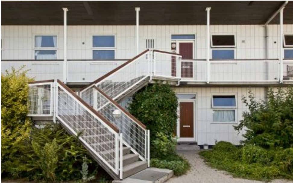
Et godt eksempel på Eske Kristensens arkitektur

sere boligbyggerier og blev en af pionererne indenfor betonelementbyggeriet. Derved kunne man have undgået megen af den kritik og det dårlige omdømme, som modulbyggeriet fik i 1970'erne.