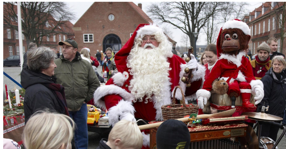
Så blev det atter jul i den gamle Avedørelejr

Søndag d. 5. december fra kl. 10-15 finder det traditionsrige julemarked i Avedørelejren sted.