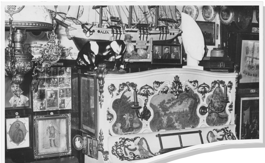
Et kig ind i "De Gamle Stuers" indretning