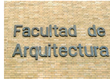
Arkitektskolen hvor mødet blev holdt

DoCoMoMo er en verdensomspændende organisation, der arbejder med at sikre bygninger og anlæg fra "modernismen" eller "den moderne bevægelse". Den mest berømte danske arkitekt fra denne bevægelse er Arne Jacobsen, men hovedparten af dansk arkitektur og planlægning i årtierne efter Befrielsen er inspireret af modernismen.