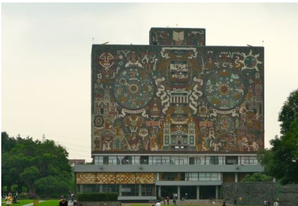
Mexicos universitet bygget i 1939-41 er verdenskulturarv