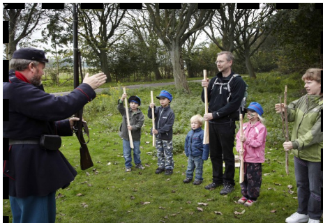
"Giv agt, gevær ved fod"

Missionen gik ud på, at børnene skulle afsløre hvornår en række spioner ville slå til og dræbe den fredselkende general. Spionernes planer åbenbarede sig i mørket i en kaponiere, og det var med spænding i øjnene, at børnene