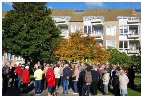
Et udsnit af de mange deltagere