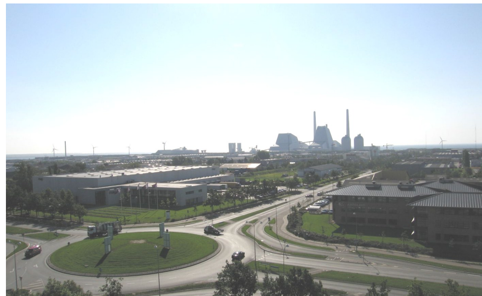
Den store rundkørsel på Avedøre Holme set fra "Bøje Nielsen Huset"

R ejste man rundt i København og omegn i midten af 1800-tallet, oplevede man et ganske anderledes landskab, end det vi ser i dag. København lå med sine sølle 130.000 indbyggere og puttede sig bag voldene fra 1600-tallet, mens oplandet mest bestod af små landsbyer og spredtliggende gårde og landsteder.