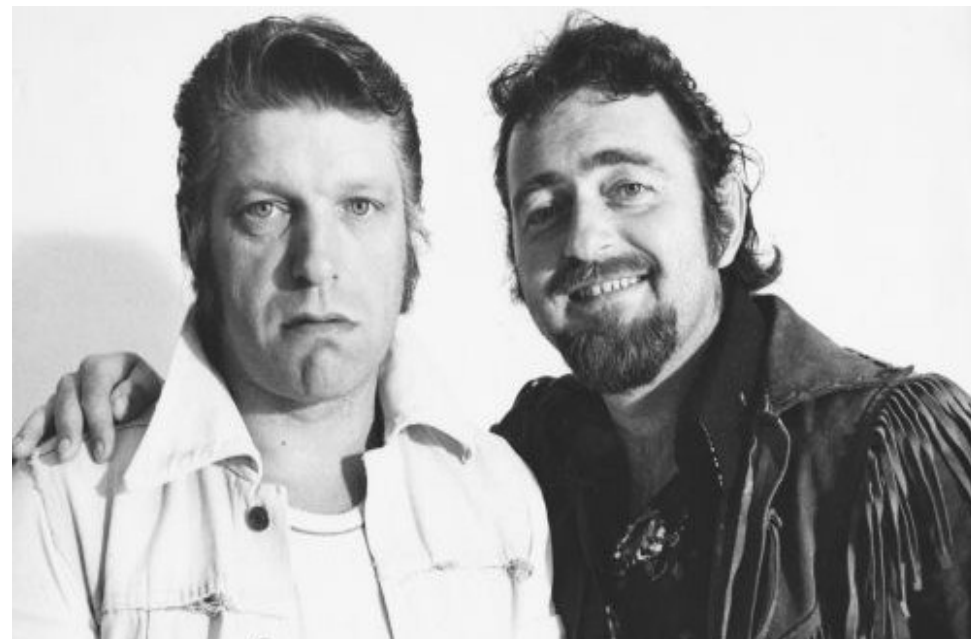
Gøglerduoen Leif Sylvester og Erik Clausen

" Ja. Kom nærmere, kom nærmere, kom nærmere mine damer og herrer. Her skal De se Ib Sylvester - drengen fra stenbroen – der nu vil stikke et syv tommer søm i næsen og dybt ind i sit hoved, derind hvor hjernemassen og fantasien normalt bor" sådan blev Leif Sylvester på fladt og ærkekøbenhavnsk præsenteret af Erik Clausen, når de stillede op med deres gadecirkus. "Vi præsenterede den ene sensation efter