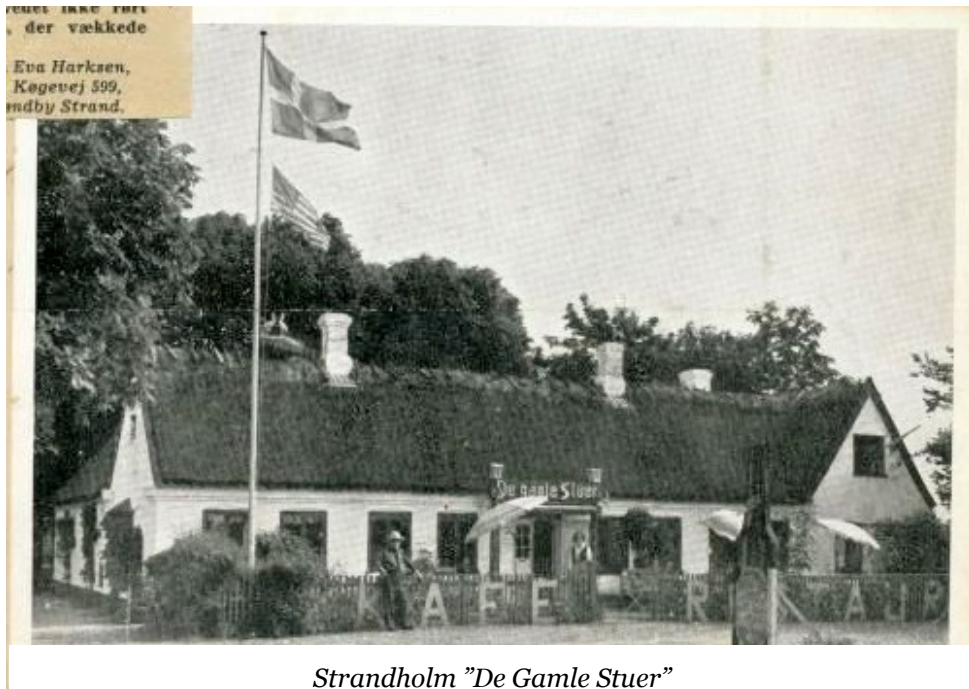
Strandholm "De Gamle Stuer"