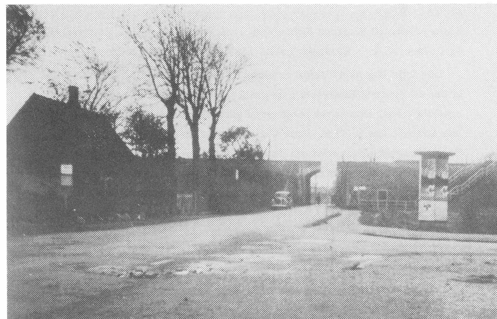
JERNBANEVIADUKTEN OVER HVIDOVREVEJ I 1938