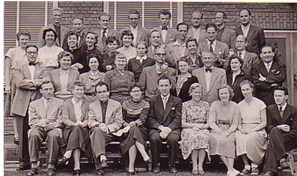
Lærerbillede fra 1954. Holmegårdsskolen.

I 1952 var der ca. 125 lærere til de 3 skoler. Ledelsen af de enkelte skoler bestod af en skoleinspektør og 2 viceinspektører. Heraf vare-