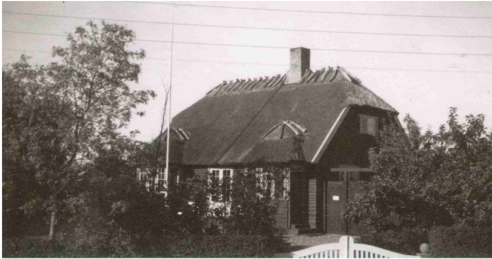
Huset på Strøbyvej 1-3