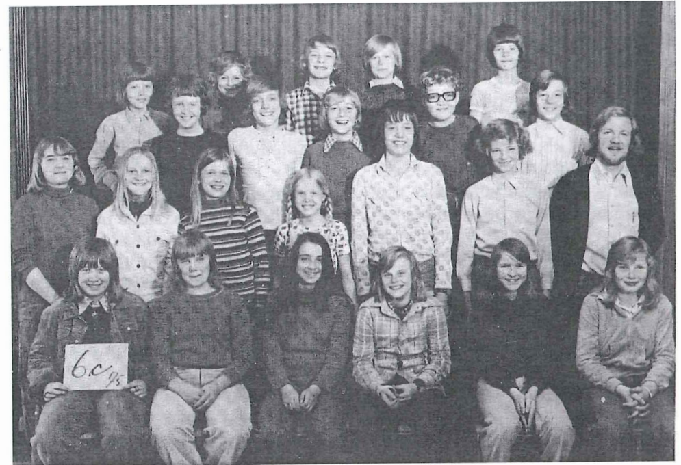
Klassefoto 1975. 6 c, Dansborgskolen

Jeg husker, vi i nogle år var af sted med børnehaveklassen og de kommende 1. kl. 's lærere. Det var en god måde at lære eleverne at kende, og læreren kunne starte sin forberedelse ud fra et bedre grundlag. Hvidovre havde også en god indskolingsordning, hvor børnehaveklassen startede nogle uger senere end den øvrige skole. På den måde var det muligt for børnehaveklasselederen at følge sin klasse nogle timer i 1. klasse og gøre overgangen lettere.