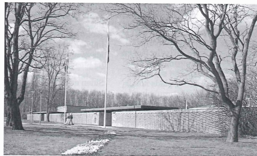
Indgangen til Brøndby Rådhus

Det første kommunale valg i Brøndby blev afholdt i 1841.