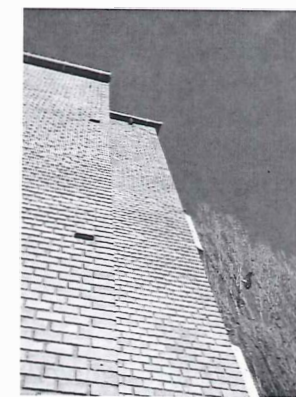
Bredalsparken – gavl. Arkitekt er Svann Eske Kristensen