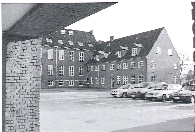
Strandmarks-skolen –i dag fritidscenter. 2009