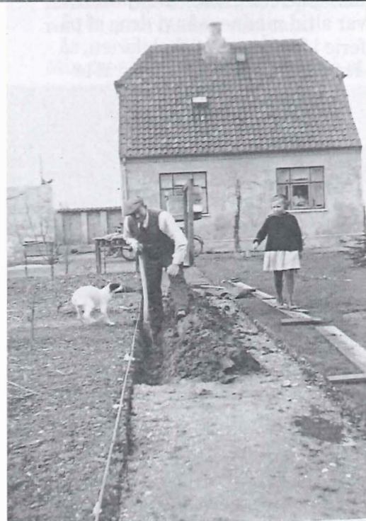
Haven giver megen sund motion og mange glæder – og en gang imellem lidt ondt i ryggen.