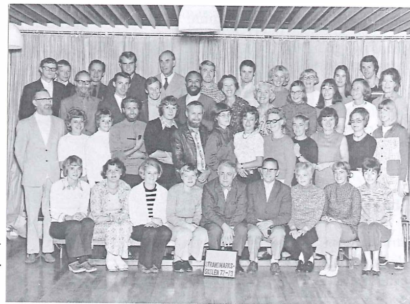
Lærerpersone, Strandmarksskolen. 1972/1973