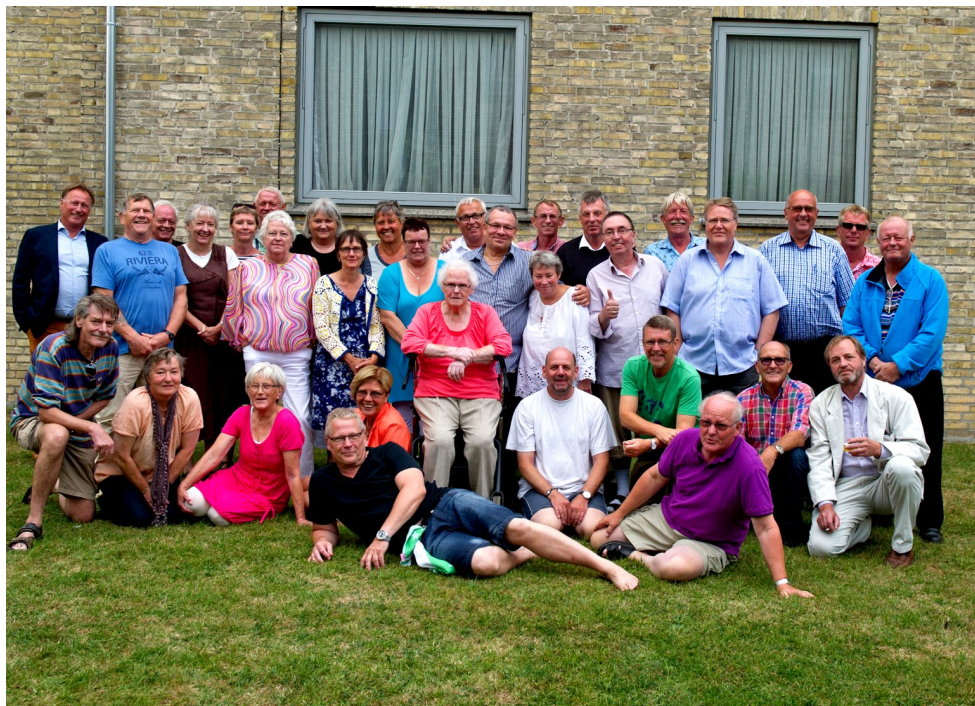
Gruppebillede af de mange deltagere i festen

mindedes lege og når vores 2 ”gårde” var i sneboldkamp med hinanden, børnefødselsdage, minder fra skolen, Hvidovre Bio og meget mere. Snakken gik om, hvordan det var gået os selv siden barndomsårene, med uddannelse, job o.s.v.