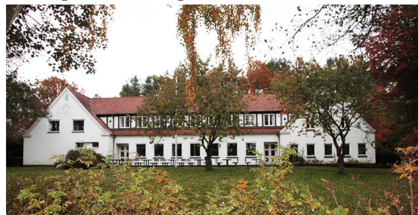
Svejlbæk Færgegård (Hvidovre Kommunes feriekoloni)