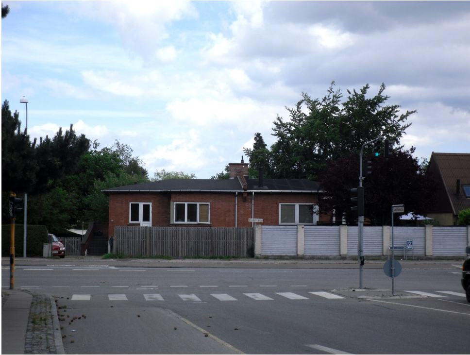
Dobbeltbungalowen på Hvidovrevej 187

lege med, fordi vi boede i villa og blev betragtet som de "fine".