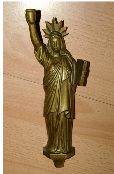
Støbeform til Frihedsgudindelampen

en esse. Jeg har selv tjent lomme-penge ved at hive i blæsebælgen, når metallet skulle smeltes, og omdannes til lamper og figurer, og hvad ved jeg. Essen findes stadig i baghuset, gemt bag et stort klædeskab, og det er længe siden, der har været ild i den, for nu er baghuset nemlig omdannet til beboelse.