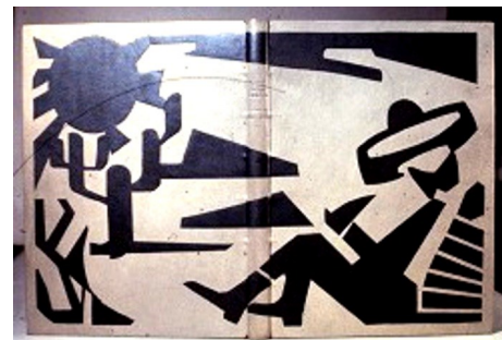
Eksempel på kunstindbinding

Efter at have fået bronzemedalje til svendep prøve, fortsatte jeg på en overbygning som håndforylder. Det går bl.a. ud på at lave kunstindbindinger af værdifulde gamle bøger. Det gjorde jeg så godt, at jeg både har vundet VM og NM i konkurrencer i kunstindbinding. Senere blev jeg uddannet som konservator i papir og skind på