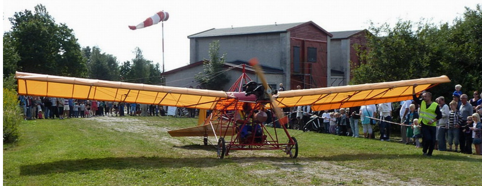
”Ellehammer” klar til start