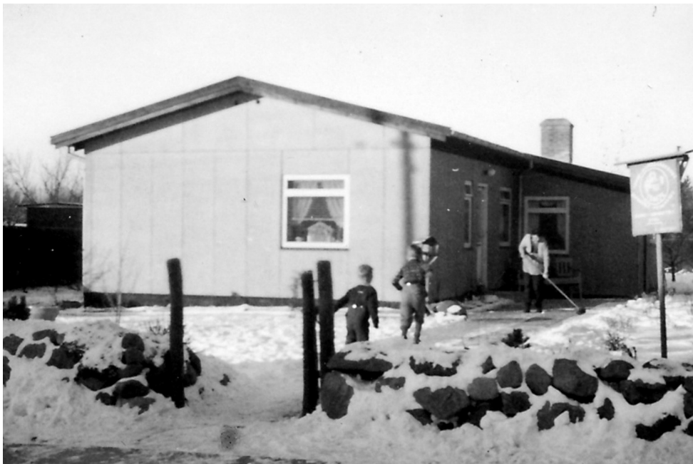
Familiens statslåns hus på Ejstrupvej 22