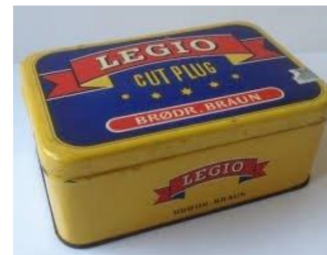
Den gule dåse med ”Mekkertobak”