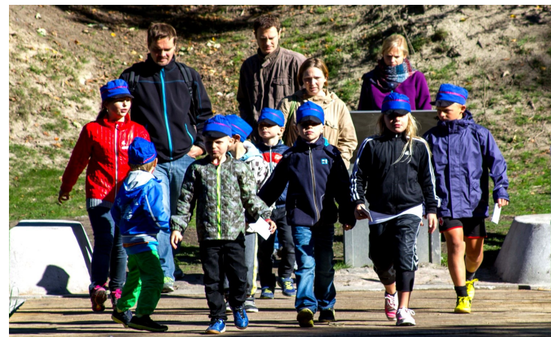
”Styrken” er parat til udfordringerne

Der er fri entré til både cykelturen og rollespillet, og der kan købes let forplejning ved den røde barak, hvor der også er toiletter.