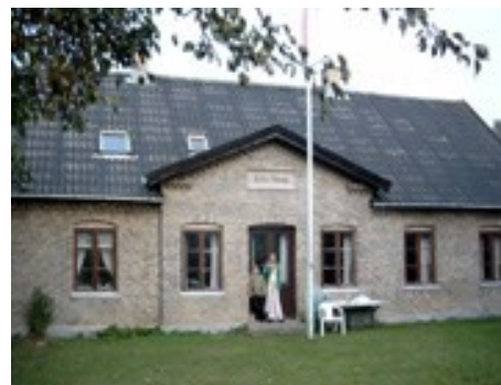
Hovedbygningen til Eriksminde, i Kirkegade (den gamle Hvidovregade)