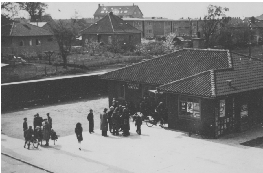
Frihedskæmpere ved Hvidovre Station

I sidste nummers artikel: "Ad kirkestien fra Valby til Hvidovre" står der side 29, at stien munder ud ved Lykkeboskolen på Vigerslev Allé. Det skulle være Vigerslevvej i stedet for Vigerslev Allé.