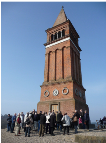
Tårnet på Himmelbjerget

re så betydningsfuld, at de bliver erklæret bevaringsværdige, og i et af foredragene hørte vi, hvilke udfordringer det giver for menighedsrådene ved de berørte kirkegårde.