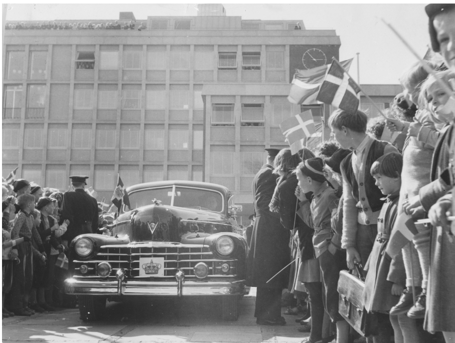
Kongeparret foran rådhuset