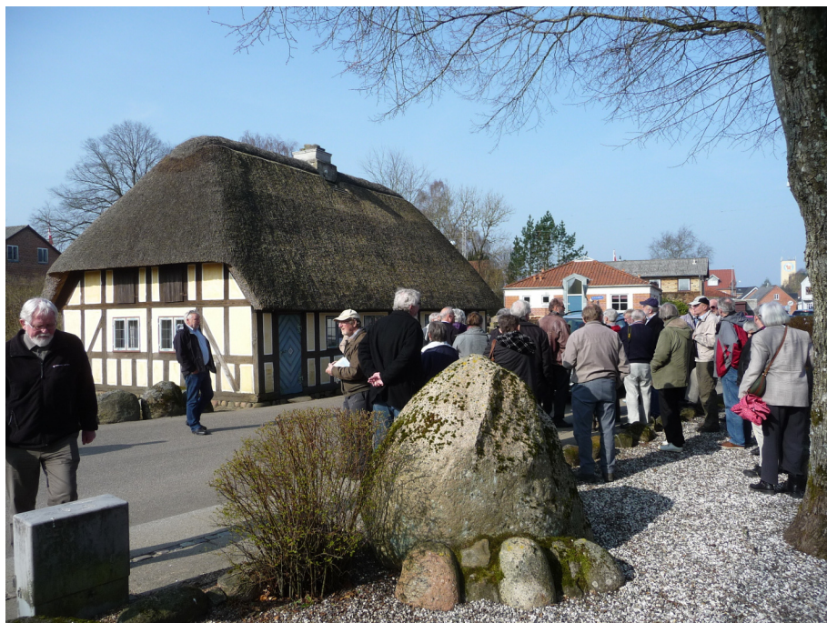
Lokalmuseum i Them

Rundt om i landet støder vi på masser af mindesmærker for begivenheder og personer, og på kirkegårdene kan vi finde dem som gravminder. Enkelte gravminders kulturarv kan væ-