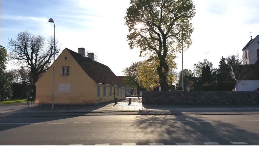
Rytterskolen april 2015

Ryttergodserne skulle sikre soldaterrekrutteringen, og den oplysningsvenlige Kong Frederik den IV fandt det var nødvendigt, at soldaterne kunne læse rimeligt og tælle til tyve. I den ånd blev rytterskolerne bestemt og opført.