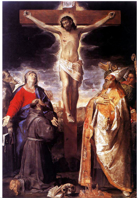
Annibale Carracci. Korsfæstelsen , 1583, (210 x 305 cm). Chiesa Santa Maria della Carità, Bologna.

i hans pompejanske dekorative kunst. Gennem alle årene havde han et tæt samarbejde med maleren Constantin Hansen. Hans hovedværker er loftsdekorationerne i Thorvaldsens Museum (rum 32 og 33, 1. sal) og udsmykningerne i København Universitets forhal og festsal. Herudover har han dekoreret adskillige private boliger, kirker og offentlige