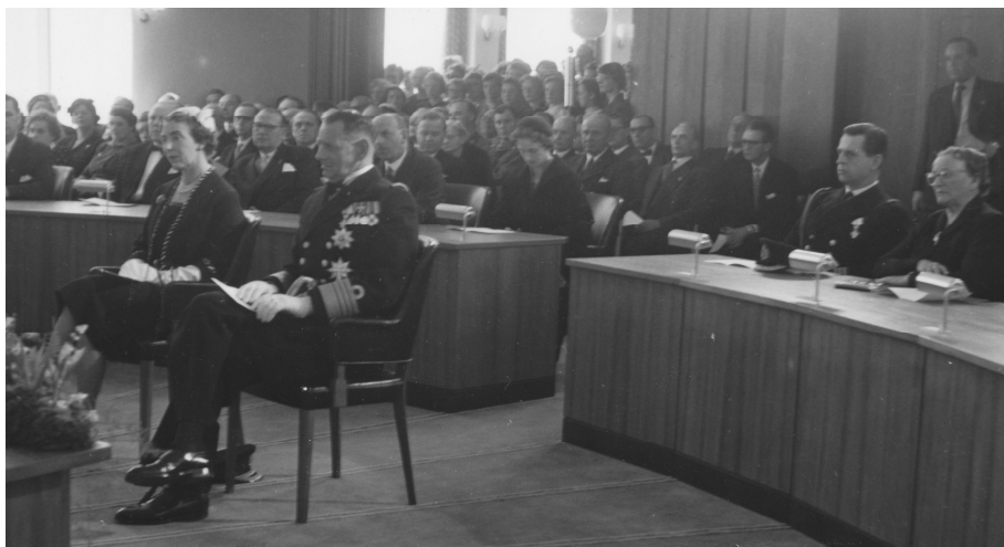
Kongeparret modtages i den nye byrådssal

Brandi bestræbte sig på at gøre interiøret så levende som muligt med stærke farver, der skifter, grønne planter og gode ventemøbler.