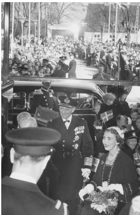
Hilser Kong Frederik og dronning Ingrid mon på borgmesteren?

Kommunen blev derfor ved med at vokse og velfærdsstaten tog form med institutioner og servicetilbud til borgerne. Og selv om kommunekontoret i Hvidovregade fik knopskydninger, lykkedes det ikke rigtig at skabe den fornødne plads. Der-