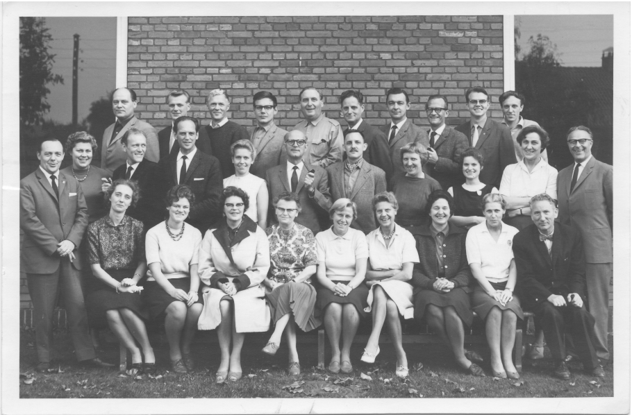
Lærerbillede Holmegårdsskolen 1962