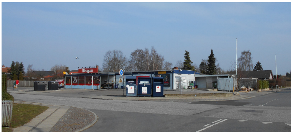
Lokalbrugsen marts 2015

I 1975, da Stationsbyen var ved at blive bygget, og der var planer om butikker der, meddelte Hvidovre Kommune Brugsen, at den tidligere godkendelse – med ½ års varsel – kunne fortsætte, og at varsellet for butikkens ophør tidligst ville blive bragt i anvendelse 1 år efter, at butikkerne i Stationsbyen var åbnet. En permanent butikstilladelse ønskede kommunen ikke at tage stilling til på daværende tidspunkt. Og tiden gik, og LokalBrugsen, som den kom til at hedde på et tidspunkt, blev liggende