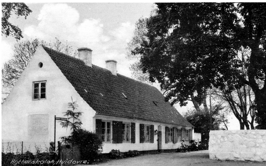
Rytterskolen i Hvidovre