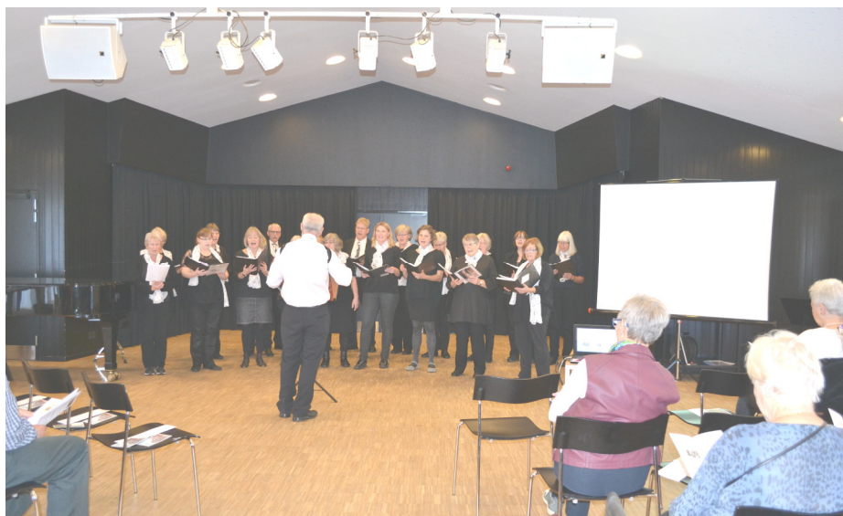
Salen på Musikskolen -SAFOLI synger.