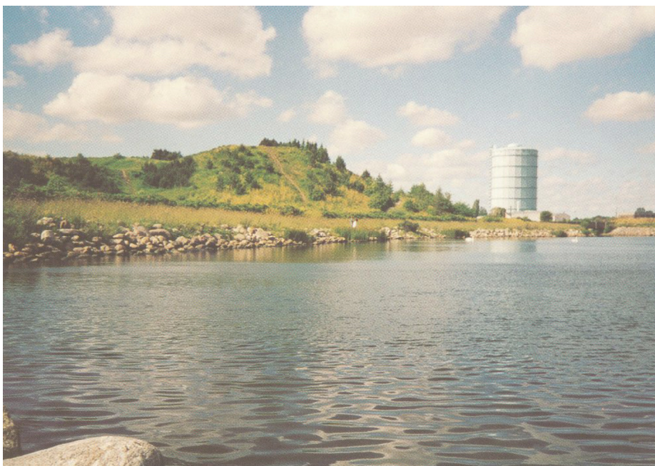
Parti fra stranden ved Bjerget

udsat for tæring på skolen, der er bygget blot 15 år tidligere.