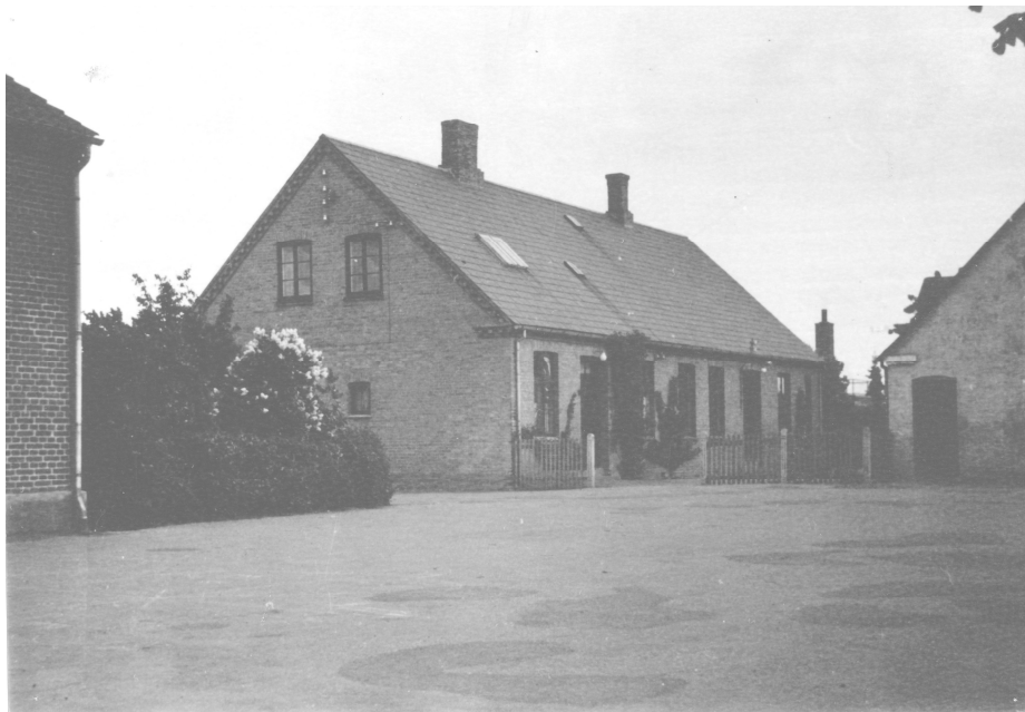
Avedøre anden skole

I 1887 stod Avedøres nye skole færdig, grundmuret og med gule teglsten. Den blev bygget lidt syd for landsbyen, måske for at markere tilhørsforholdet til de sydlige områder. Som den gamle indeholdt den både lærerbolig og en skolestue mod nord.