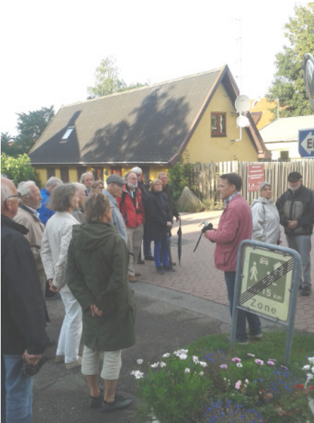
Hvidovregade - I baggrunden nr. 25, der nu er ældste hus i gaden.

I landsbyens storhedstid – inden udskiftningen i slutningen af 1700-tallet – bestod den af 29 gårde og 50 småhuse. På tværs af Hvidovregade var der 3 stræder. Gårdene lå på hver sin side