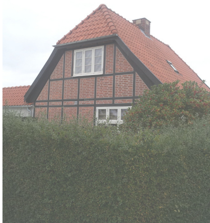
Bindingsværkshus fra 1927 på Risbjergvej 21

anlagt have foran den tidligere butik, men oprindeligt har der været en lille plads foran butikken. Længere henne i nr. 21 findes et bindingsværkshus fra 1927. Den type huse fik en renaissance i begyndelsen af 1900-