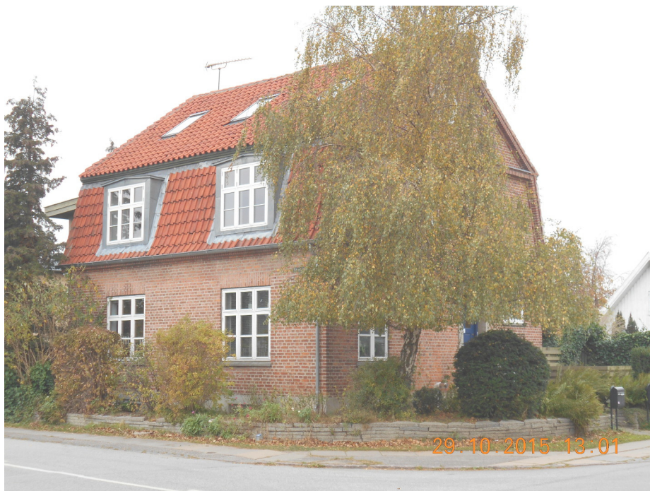
Risbjergvej 5

omtalt i forbindelse med bymidteprojektet og har gennem tiden ofte været til diskussion. Det vi ser i dag, er stuehuset fra 1878.