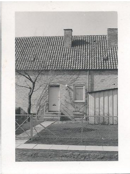
Ørager 14 A

Det var en super moderne lejlighed med centralvarme, bad og toilet - og vaskekælder med gasfyret vaskekedel, vi flyttede ind i, men som årene gik, og vi havde