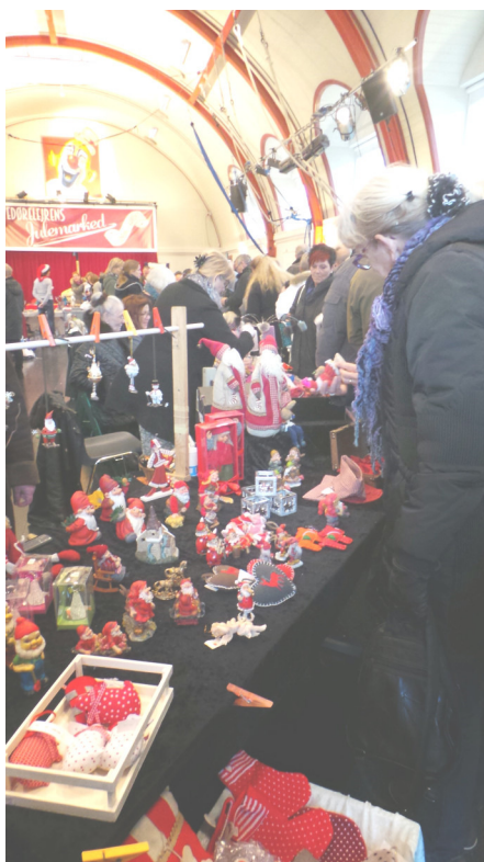
Fra julemarkedet 2014

afholdes det 11. julemarked i Avedørelejren. Der vil blive sørget for masser af underholdning og en hyggelig ramme, hvor du kan have en studeplads