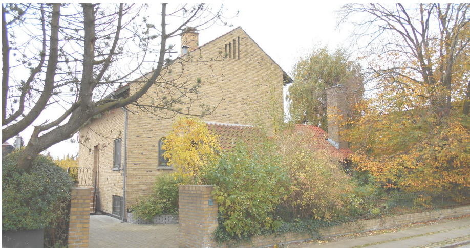
Greve Allé 58

af gedigne materialer. Murermestervillaen som bolig er det første egentlige typehus, vi kender i Danmark. Kendetegn er den blanke mur, rødt tegltag med opskalkning og trævinduer med sprosser.