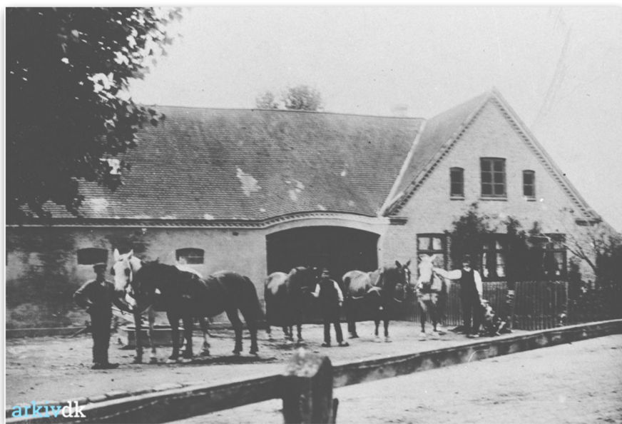
Nørregård - Hvidovregade 4

nogle bønderkarle havde taget hans kæmpestore luffe, som han ved et uheld havde tabt ved åen. Efter den episode så man aldrig mere "bjergmanden"!