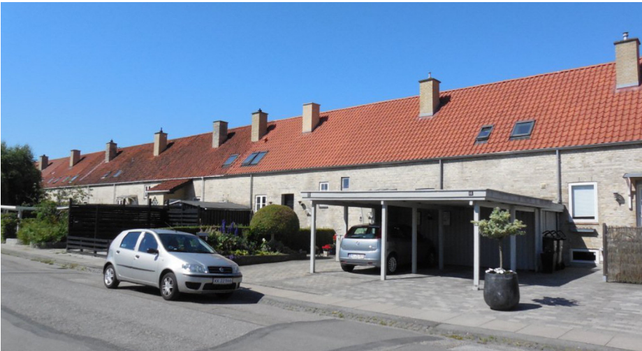
Ørager mod syd (foto 2015)

kunne naturligvis tydeligt se, at der havde været gravet, og det kan vi den dag i dag i 2015 – 30 år efter. For at føje spot til skade etablerede Hvidovre Fjernvarme Selskab i 2011 fjernvarme i området, så nu har vi et spor efter etableringerne af både Naturgas og Fjernvarme i hver sin vejside og krakeleret asfalt på midten samt mange knækkede fortovs-