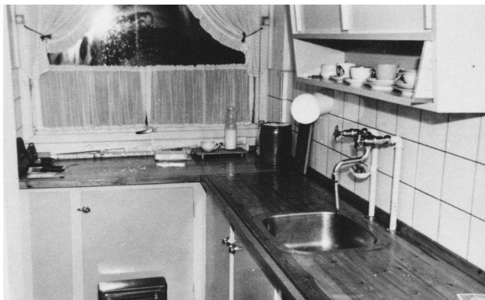
Køkken i Bredalsparken 1959

Festerne og arrangementerne er der stadig. Hvert år afholdes der julefester for børn og voksne, ældreskovtur og Høpsivøp-