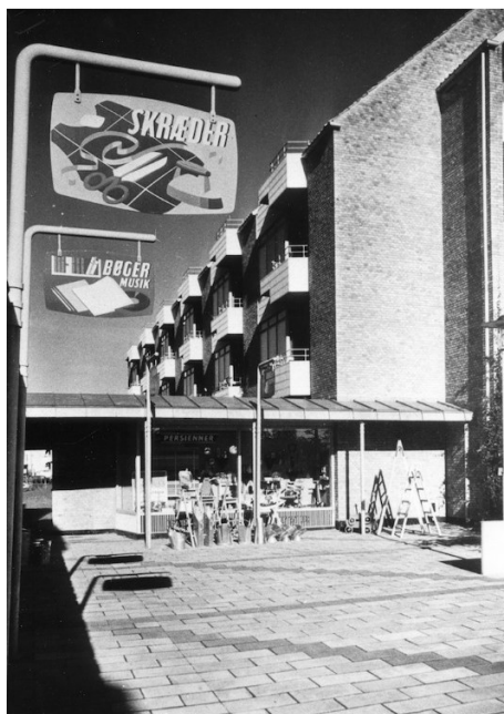
Bredalsparkens Butikstorv, 1950'erne. Kun 7% af beboerne havde bil. Derfor var det godt at kunne hente varerne tæt på eller få dem bragt til døren

Der var mange børn i Bredalsparken i 50'erne og 60'erne. Det tog man højde for. Der blev indrettet legepladser, fodboldbaner, og på Sognegårds Alle blev der opført en børnehave og et fritidshjem, som og-