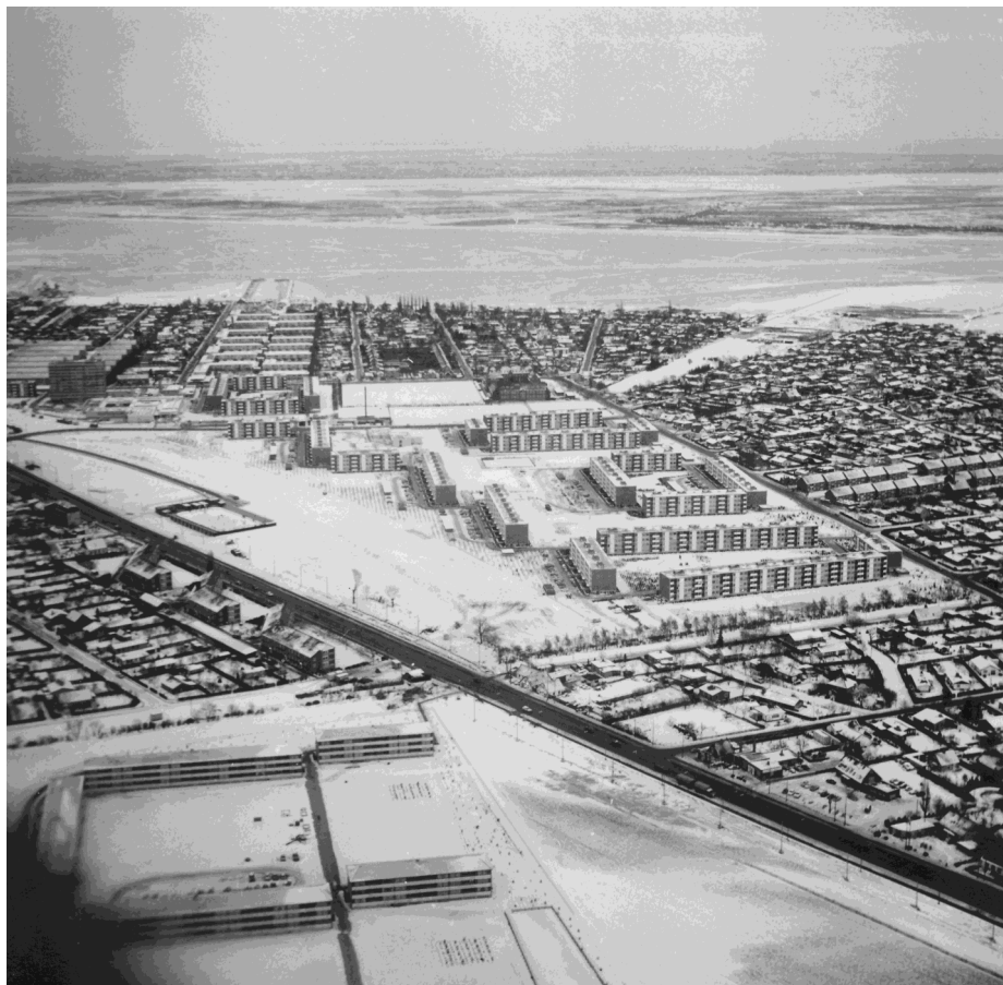
Friheden under opbygning - set mod øst

Senere blev Engstrandsskolen og Frihedens Idrætscenter bygget, så det var et godt sted for børnene at vokse op.