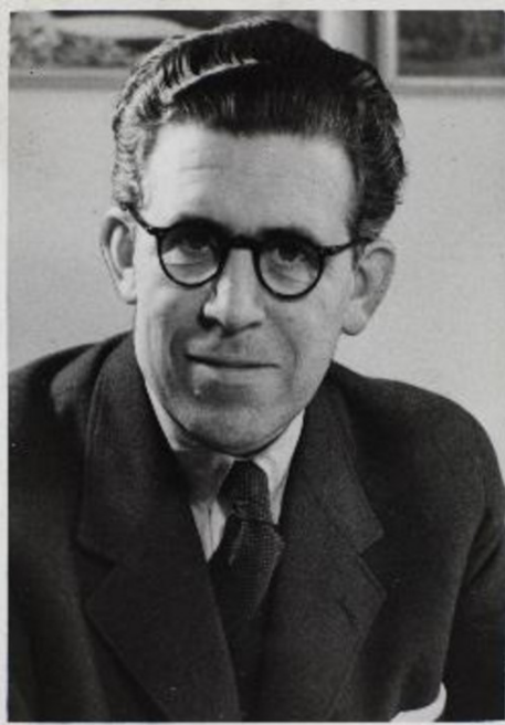
Svenn Eske Lristensen Foto Det Kgl. Bibliotek

Bredalsgårdens jorde, og da de første beboere flyttede ind, blev der stadig brevet landbrug på gårdens jorde, så beboerne blandt andet oplevede, at der blev høstet med traktor det meste af natten lige op ad deres soveværelser. Gården blev i 1948 solgt til det nystiftede Hvidovre almennyttige Boligselskab, men allerede i 1900 var et mindre areal blevet solgt fra. Køberen var eje-