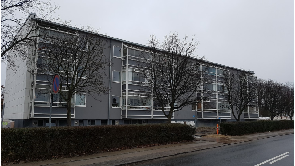
Friheden - Hvidovre Enghavevej - 2017 efter renoveringen