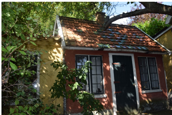
Gisegårdsvej 29 Pandekagehuset

melding og datoer vil blive meddelt i Hvidovre Avis og på Forstads Museets hjemmeside senere, men her får I allerede nu en lille appetitvækker om, hvad fyraftensrundvisningerne i 2017 byder på. Vel mødt!