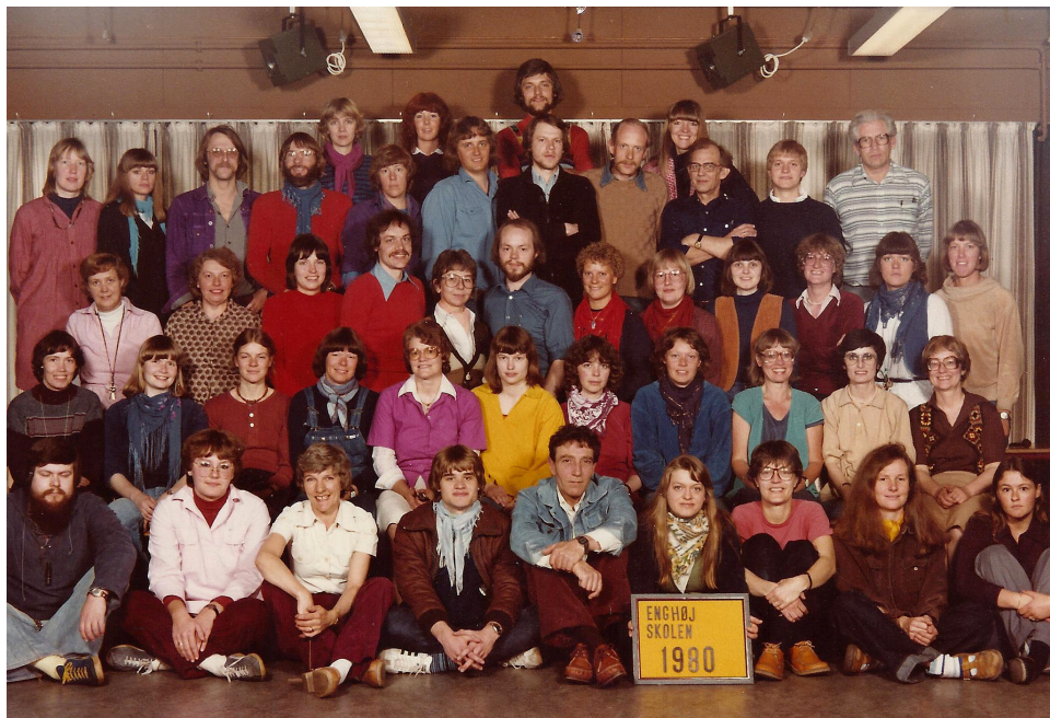
Enghøjskolen Lærerpersonalet 1980