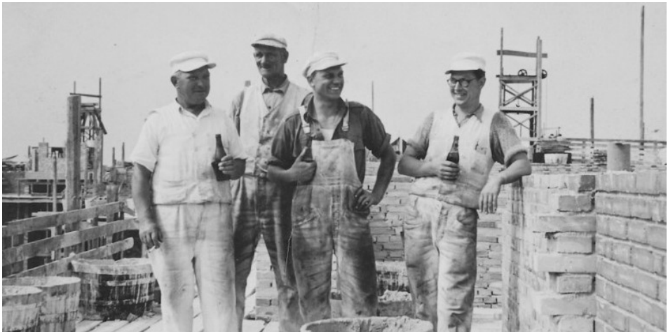
Murerne får en velfortjent pause i byggeriet

var lys, luft og grønne områder. Man ville give den almindelige familie mulighed for at komme ud af byernes slum og mørke baggårde og skabe gode boligforhold for de mange mennesker, som vandrede fra land til by.