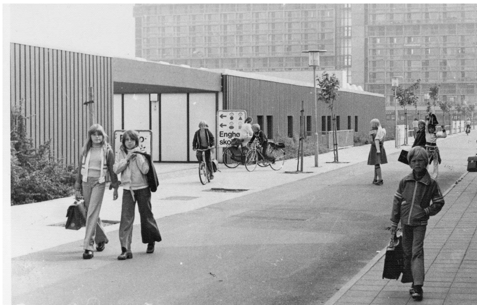
Enghøjskolen før ombygningen

ger i Avedøre Stationsby, der var større end de små lejligheder på Københavns brokvarterer.