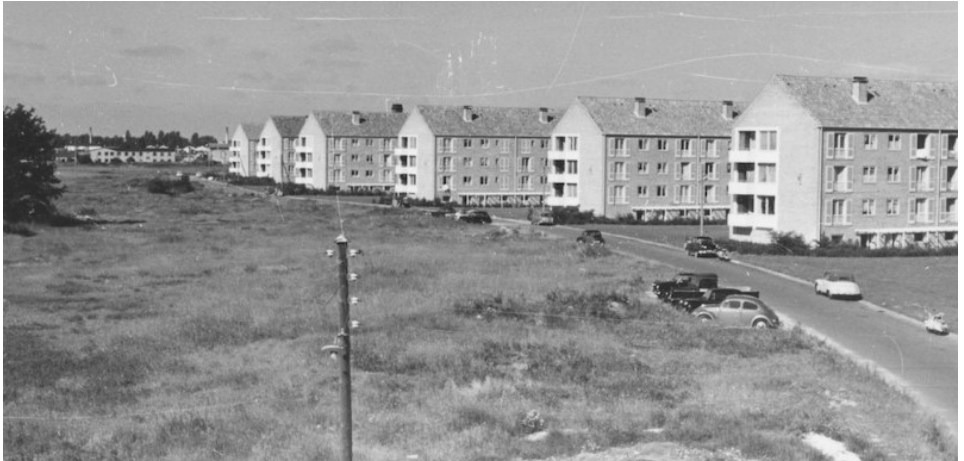
Gurrevej 1955-1960 - før opførelsen af Slangehuset

og bliver i øvrigt kaldt ”gin- og limekvarteret”.