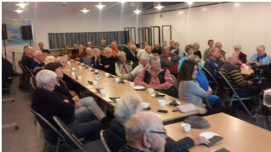
Stort fremmøde til foredraget om 2. Verdenskrig i Hvidovre