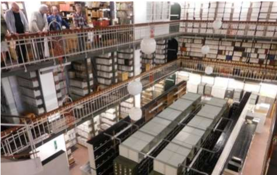
Det danske Magasin