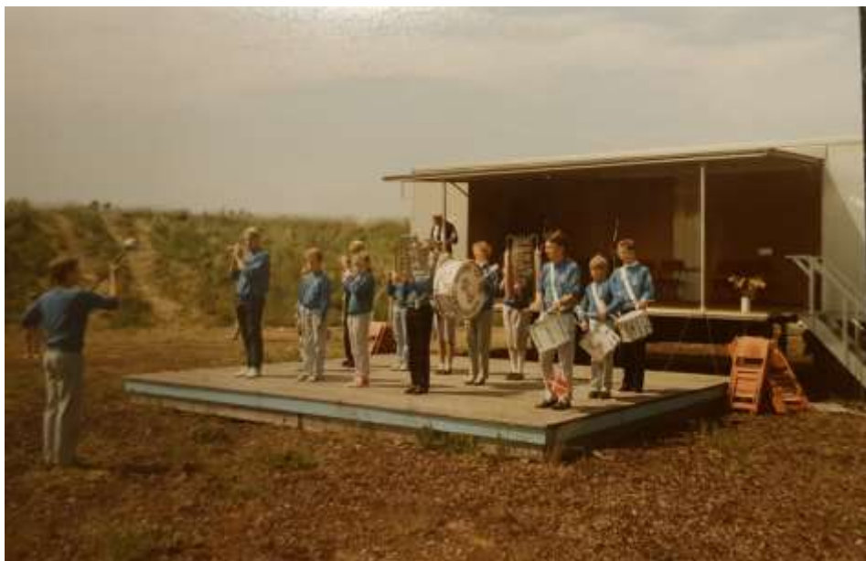
Tamburkorpsset spiller i amfiteateret ved Poppelgården 1989