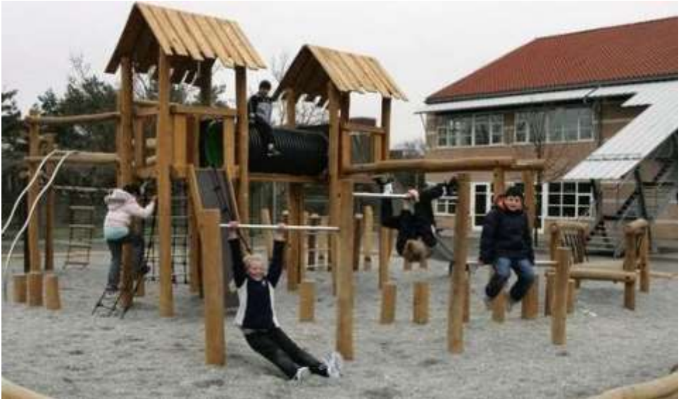
Skolegården på Enghøjskolen