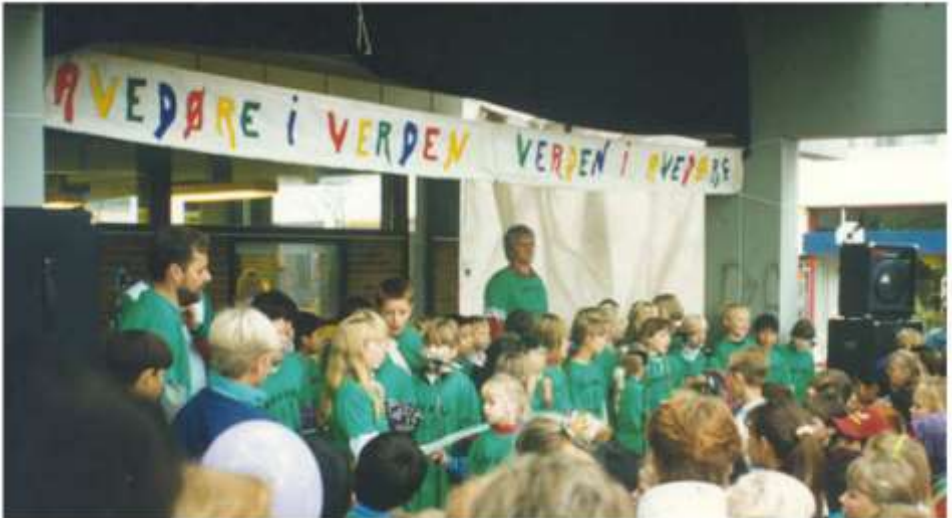
Enghøjskolen ved Mangfoldigheden

strandskolen kæmpede kraftigt imod denne beslutning. Og i september 2011 blev beslutningen ændret til, at det nu i stedet var Enghøjskolen og Sønderkærskolen, der skulle lukkes, og elever og personale flyttes til tre andre skoler i området. Beslutningen blev efter mange indsigelser stadfæstet på et møde i kommunalbestyrelsen d. 28. februar 2012. Lærerne på Enghøjskolen var lamslåede. Nok var skolens elevtal faldet til under 300 ele-