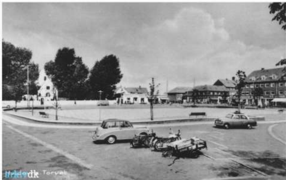
Hvidovre Torv - 1953