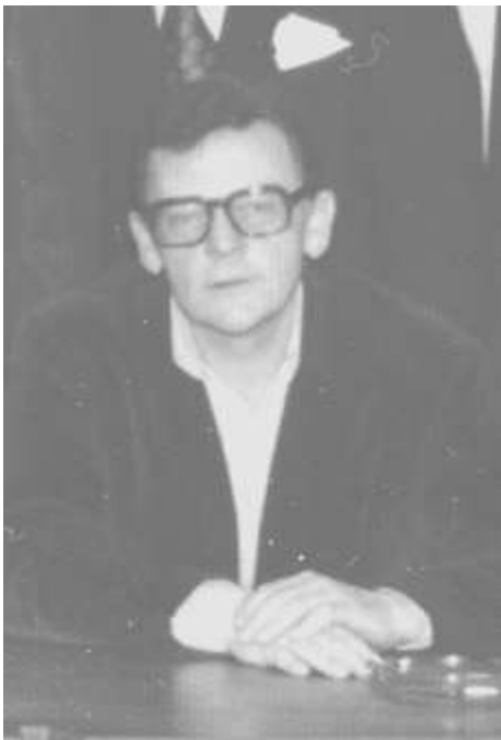
Palle Voigt