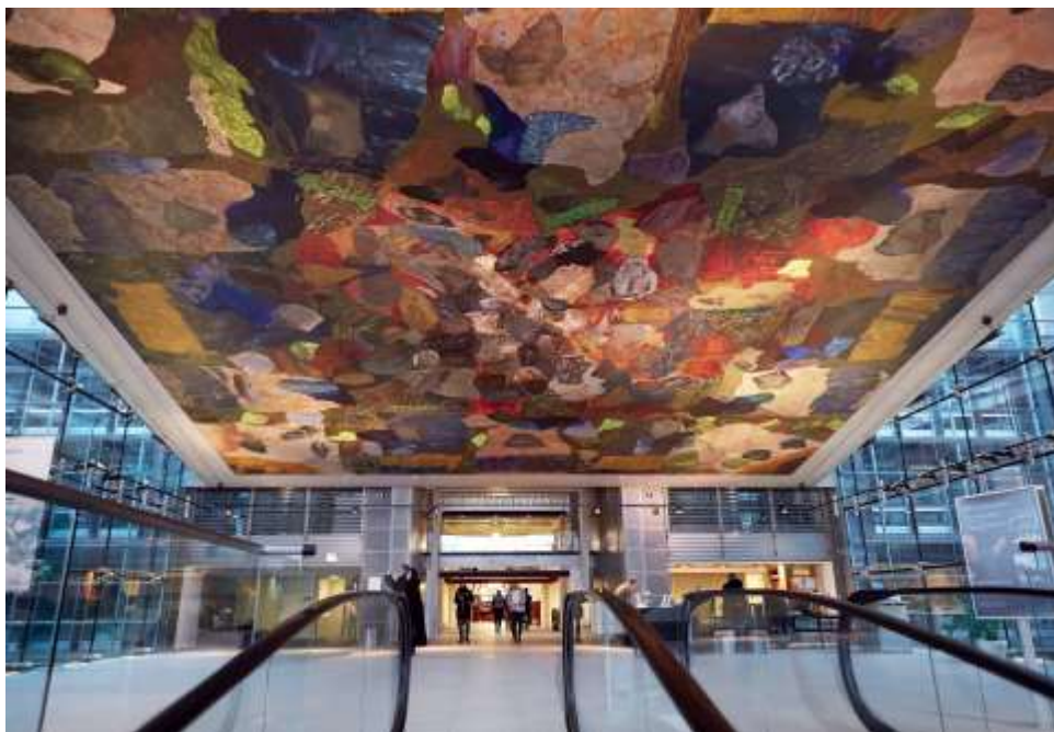
Kirkebybroen - 2013

Kristian fortælle os. Da biblioteket blev bygget i 1906, blev det kun i læsesalen, at der blev installeret elektricitet - i de flotte grønne glaslamper. Elektricitet var kommet i København i 1880, men blev i 1906 stadig ikke betragtet som noget, der ville være blivende.