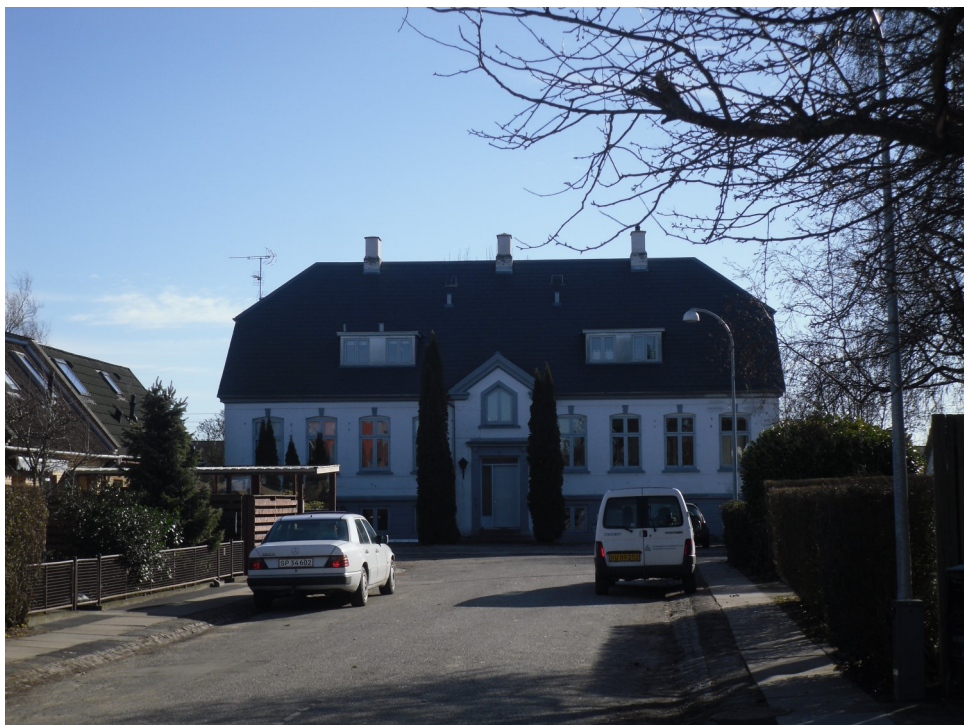
Skelgården Orfeus Alle 8

dringer fra slutningen af 30.erne og 40.erne. En god og lærerig aftentur blev rundet af med, at Lokalhistorisk Selskab var vært til en øl/vand efter turen.