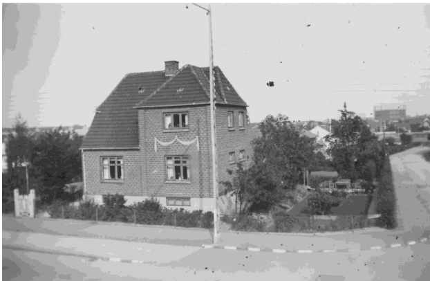
Villa Åstrupgårdsvej 1 (Hvidovrevej 99). Privatfoto, årstal ukendt.

da billederne er taget med kendte bygninger som baggrund.