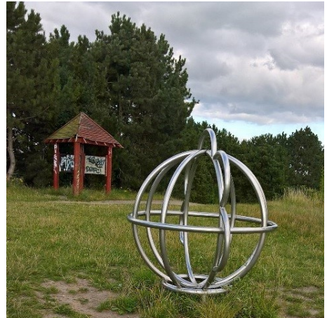
"Solen" på toppen af Bjerget i Kystagerparken

halvcirkel ud i vandet af 20-30 store fedtede sten, det er vist længe siden, der har været nogen i vandet der, men der sad