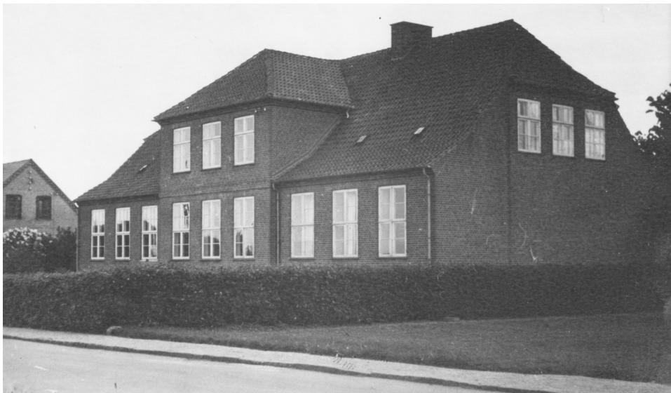
Avedøre 3. skole - Foto: Forstadmuseet

I 1929 får Avedøre sin tredje skole. Det er den store røde bygning på Byvej 56, der nu benyttes af Hvidovre Amatørszene. Da den blev rejst, dannede den rammerne om ekspansionen gennem godt et kvart århundrede, en udvikling, der efterhånden medførte ansættelse af flere lærerkræfter.