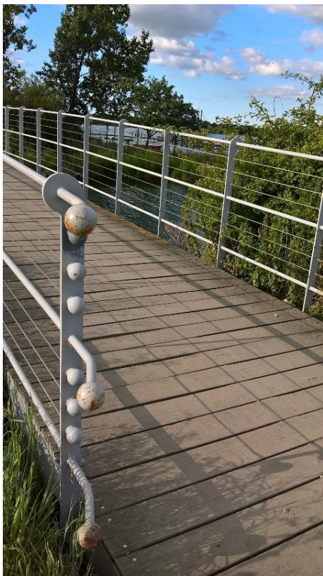
Broen over Mørtelværksrenden