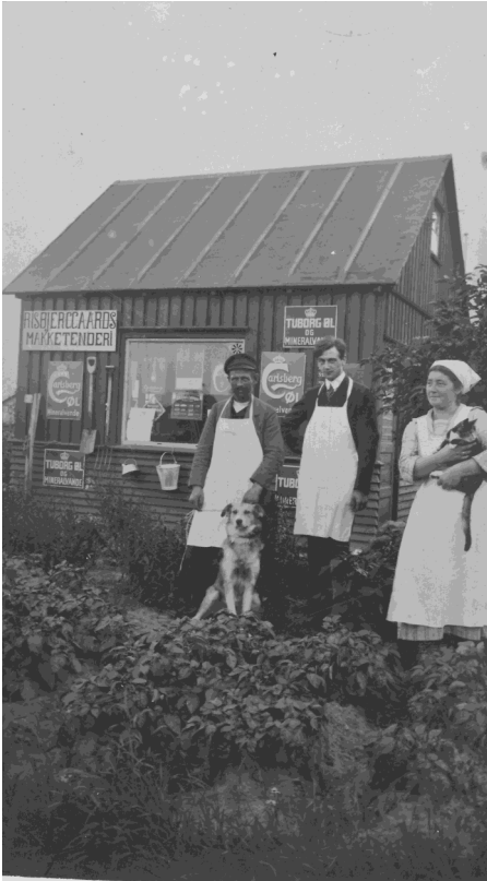
'Risbjerggaards Måkketenderi', 1929.