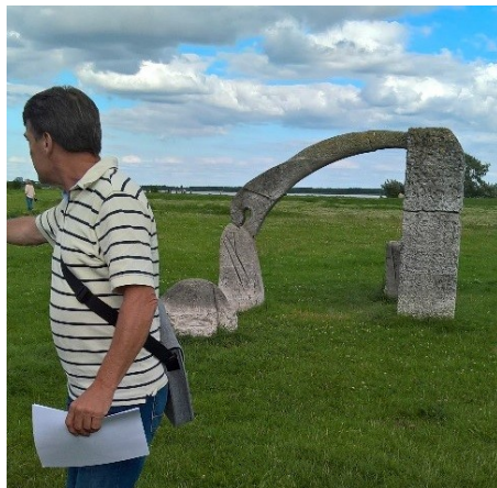
"Broen der bider"

Men industriområdet blev ikke til noget, i stedet kunne vi ved første stop konstatere, at der var fri udsigt gennem hullet i Haugen Sørensens "Broen, der bider" – helt til Vestamager over det, der før var sump og rørskov. I tidligere tid var Kalvebod dobbelt så bred, nu kan man næsten gå derover, hvis man lige hopper lidt over sejlrenden. Haugens skulptur har engang været angrebet af en vred mand med en hammer, tegn på at man forholder sig til kunsten, lidt ligesom porten ved Frihedens Station,