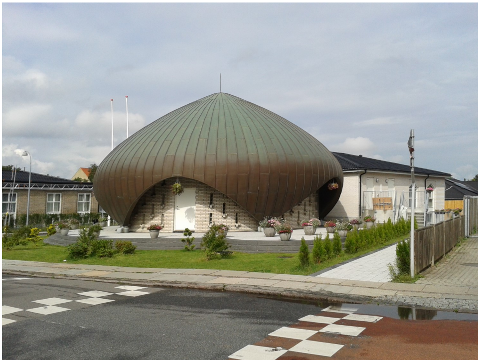
Nusrat Djahan Moskeen i Hvidovregade - Foto: Jens Frederik Jørgensen

Kommune købte i 1930erne. Som et minde om gården kan man stadig se en imponerende blodbøg. Københavns Kommune har i sin jordpolitik og i sine opkøb i omegnskommunerne været meget forudseende. På et kort fra 1936/37 har Københavns Kommune på Spurvegårdens jorder anført ”Fremtidigt Hospital”. Poul