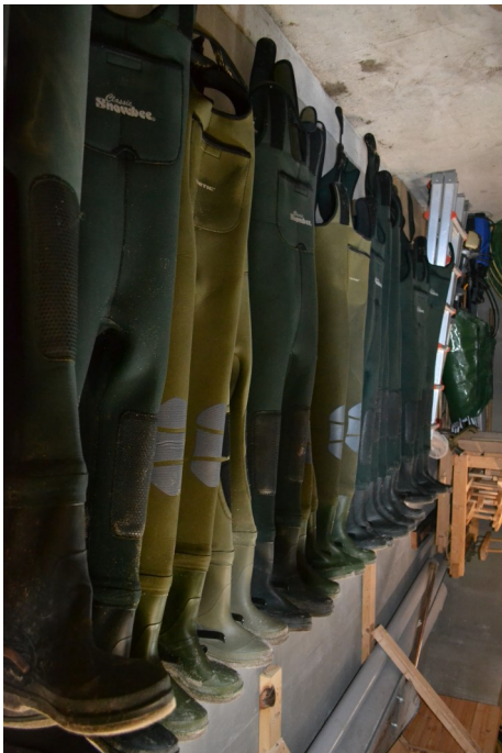
Waders - Foto: Jette Randal-Lund

3. Quarkcenteret prøver at dække de områder inden for det naturfaglige område, der skal sættes fokus på i folkeskolen. F.eks. energiproduktion i Hvidovre, får og uld, fra brøker til muld, hjerne og hjerte, kyst og hav, vindmøller og solenergi. Vi blev præsenteret for et af dagens undervisningsforløb, hvor man dissekerede hjernen på et lammehoved. Som alle sagde:” Det er helt anderledes end, da vi gik i skole”.